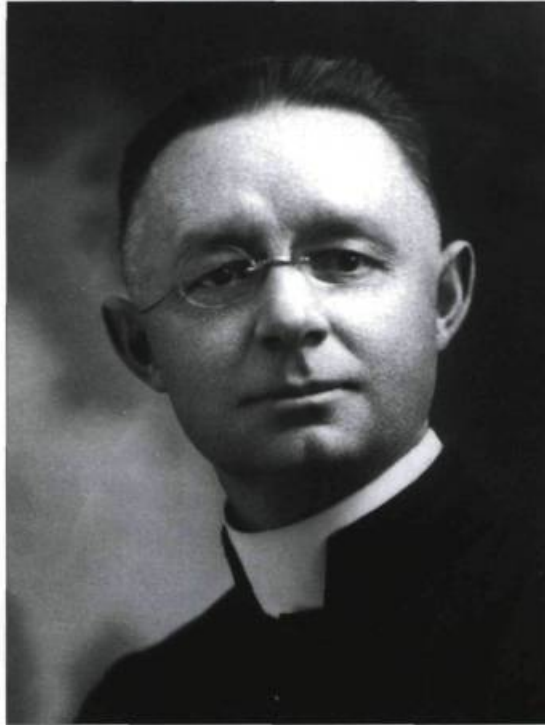
L'abbé Lionel Groulx a inspiré divers groupes de jeunes au milieu des années 1930. Plusieurs d'entre eux ont adhéré au nationalisme canadien-français mis de l'avant par Groulx.

Des extraits de ses textes séparatistes de 1936 et une brève notice biographique figurent dans l'anthologie indépendantiste préparée par Gaston Miron et Andrée Ferretti (Éditions de l'Hexagone, 1992). L'historien Maurice Séguin, théoricien du mouvement indépendantiste contemporain, dans son étude sur la genèse et l'historique de l'idée d'indépendance au Québec, présente en