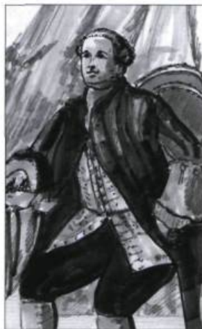
Sir William Phips. (Illustration : ministère de la Culture et des Communications).

T n août 1690, Increase Mosley monte à bord de l'un des navires de la flotte de l'amiral Phips. Il périt en mer, à l'anse aux Bouleaux, dans l'actuelle municipalité de Baie-Trinité sur la Côte-Nord, au retour de l'expédition contre Québec. Sa femme Sarah, enceinte d'un fils au moment de son départ, attendra jusqu'en 1703 pour se remarier.