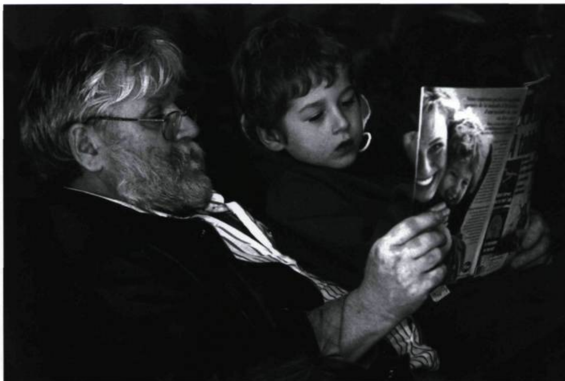
La lecture, lien entre les générations. Photographie Jean-Marie Villeneuve, 1997. (Archives de L'Institut Canadien).