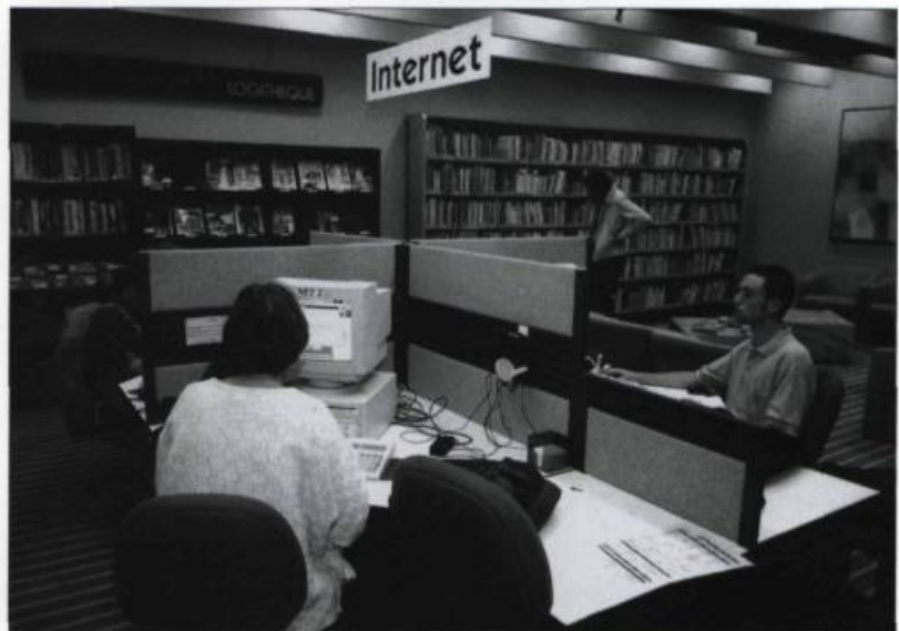
Les bibliothèques vivent à l'heure d'Internet. Photographie Jean-Marie Villeneuve, 1997. (Archives de L'Institut Canadien).

la devise Utile dulci (utile et agréable), les pionniers de L'Institut ont très bien traduit l'essence même de cette organisation qui aspire maintenant à conquérir le XXI e siècle avec la même fougue qui l'anima au cours des deux siècles précédents!