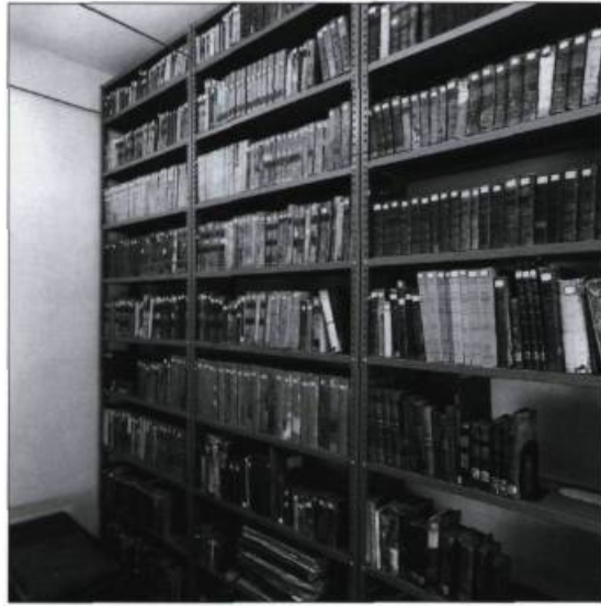
L'Institut Canadien conserve de nombreux ouvrages des XVIII e et XIX e siècles. Photographie Brigitte Ostiguy, 1998. (Archives de L'Institut Canadien).

donne le classement par sujet pour adopter celui par ordre alphabétique d'auteur, jugé plus pratique.