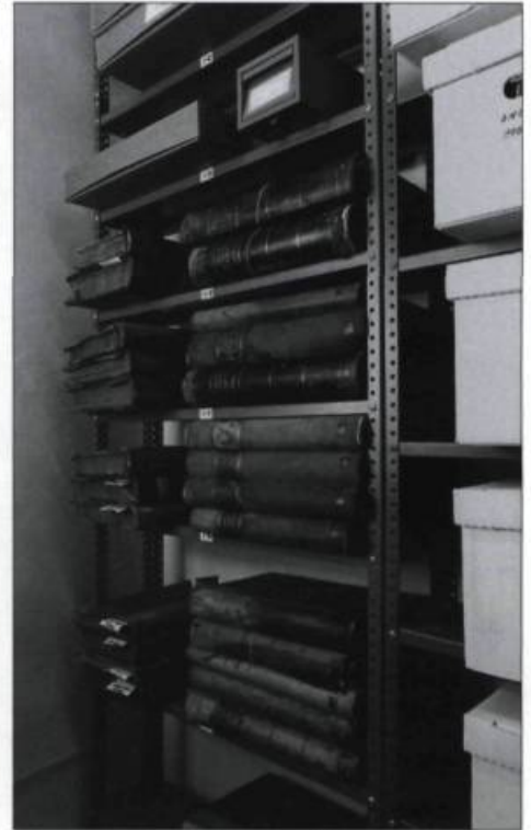
Les vieux registres de prêts de livres sont conservés dans la voûte des archives de L'Institut. Photographie Brigitte Ostiguy, 1998. (Archives de L'Institut Canadien).

Les problèmes entourant le choix des publications ne font que commencer. Entre l'offre et la demande plane l'ombre d'une éminence grise. Un comité de surveillance, appelé aussi « comité de révision », s'occupe activement du choix des livres. Ce comité pratique en fait une sorte de censure préventive ou d'autocensure. En 1850, Pierre-Joseph-Olivier Chauveau, qui en fait partie, avec François-Xavier Garneau, mentionne l'orientation qu'il veut donner à la collection et les types d'ouvrages qui s'imposent dans cette bibliothèque : « Il [le comité] lui a été impossible de se dissimuler le fait qu'un grand nombre de lecteurs donnent une préférence marquée aux ouvrages de littérature légère, tels que romans, nouvelles, études de mœurs et impressions de voyages. Votre comité a cru concilier les goûts de ces lecteurs avec les besoins beaucoup plus