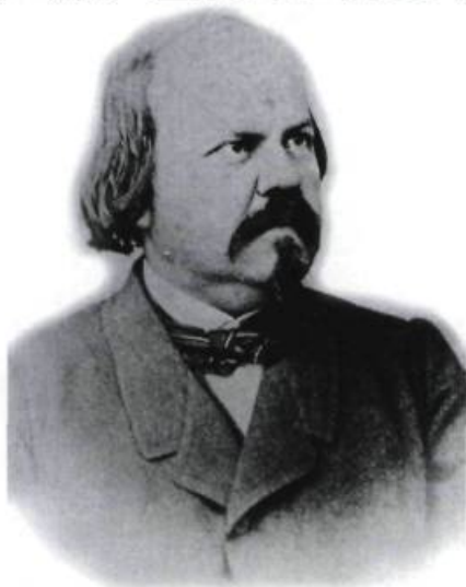
Octave Crémazie, l'exilé, fait un séjour à Paris à la fin de 1867. Photographie de Livernois, d'après une photo de Paris. (Collection privée).

Plaque commémorative sur l'une des maisons de la côte de la Fabrique où était située la librairie des frères Joseph et Octave Crémazie. Photographie Brigitte Ostiguy, 1998. (Archives de L'Institut Canadien).