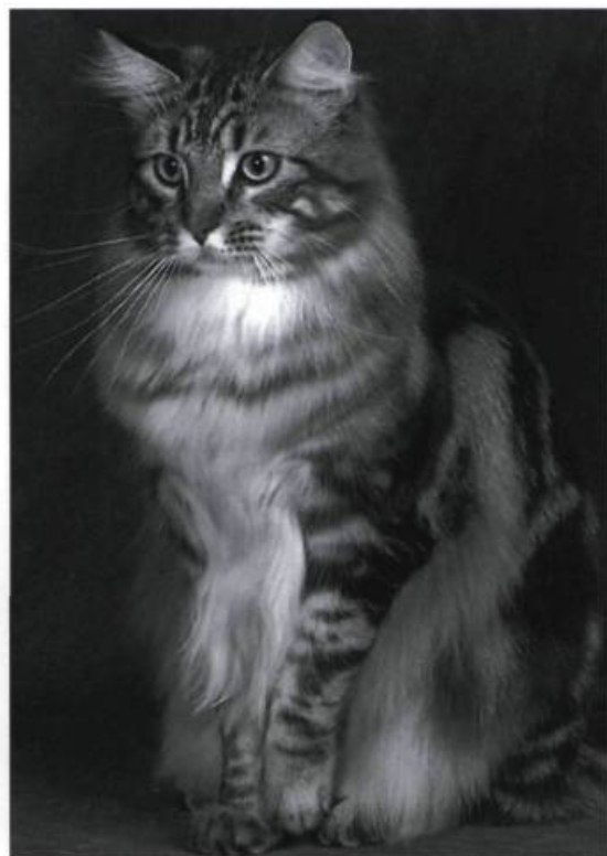
Le Maine Coon, une race d'origine américaine est un chat grand et costaud qui a réussi à résister aux rigueurs du climat de la côte Atlantique. Il est aujourd'hui reconnu et fort populaire à travers le monde.

«Chat américain» illustration du Codex canadiensis attribué à Louis Nicolas, vers 1677. Traité des animaux à quatre pieds terrestres et amphibies qui se trouvent dans les Indes occidentales ou Amérique septentrionale. Archives nationales du Canada, Fonds français, cote MG-7, I, A2, volume 12223.