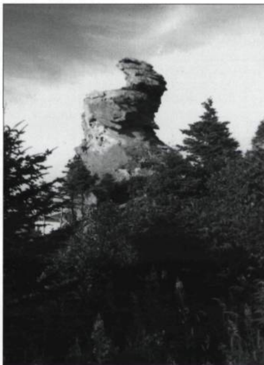
La forme particulière de ce rocher aurait donné son nom à la ville de Cap-Chat. (Photo : Louise Laliberté, m.v.).

mystère qui ne fait qu'augmenter son attrait. On choisit d'avoir un chat pour sa compagnie et son amitié et il semble que les chats eux-mêmes soient bien décidés à ce que les choses demeurent ainsi! On n'est peut-être pas si loin, finalement, de la vénération que leur portaient les Égyptiens... Le Musée de la civilisation de Québec l'aurait-il pressenti en inaugurant, tout dernièrement, un espace découverte intitulé «Ces chats parmi nous»? ♦