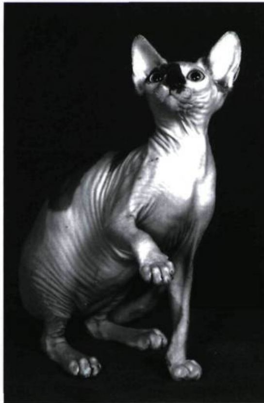
Le Sphinx, une race issue d'une mutation génétique, est un chat caractérisé par son absence de poil. Curieusement, cette race est apparue à Toronto, au milieu des années 1950.

Puis, le sport félin traverse rapidement l'Atlantique. À partir de 1880, plusieurs expositions se tiennent à Boston, New York et Chicago, dans le cadre de foires agricoles. La félinophilie améri-