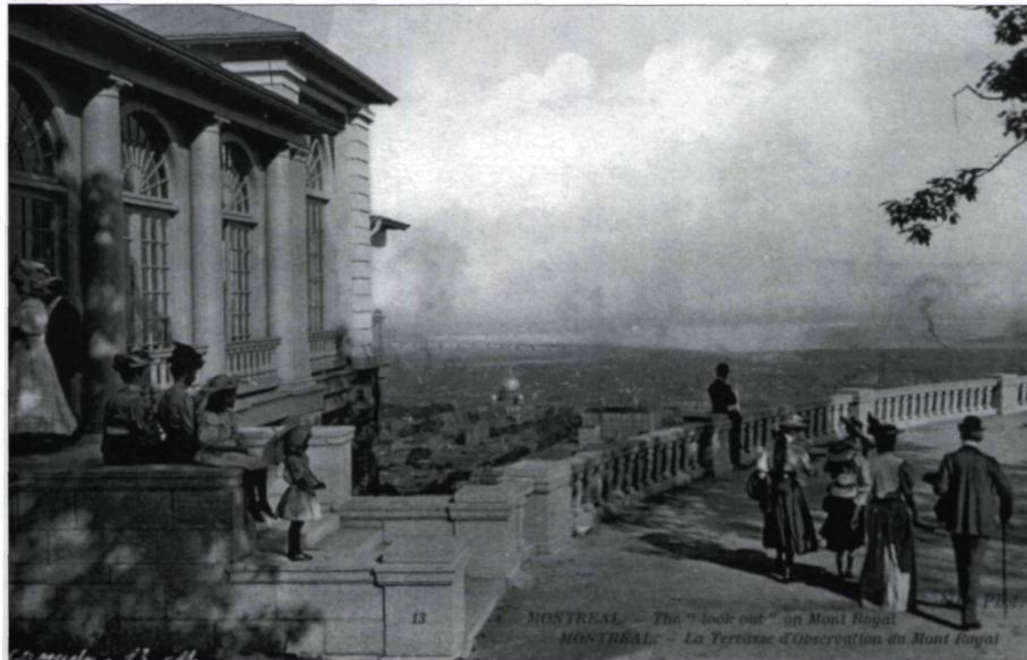
«MONTREAL - La Terrasse d'Observation du Mont-Royal». (Collection Yves Beauregard).

tales pour tout le monde et à l'aube d'une gourmandise d'images, un très grand nombre de studios de petites villes et de villages et de nombreux particuliers vont croquer leur milieu et témoigner de la vie. Ces productions sont parmi les plus recherchées des amateurs. À partir de 1905, la carte postale québécoise connaît une sorte d'âge d'or auquel seule la guerre de 1914 viendra mettre fin. Aux dires de Poitras, l'année 1908 marque un sommet chez nous et cela se comprend. Depuis plusieurs années, le pays et sa capitale fondé par Samuel de Champlain en 1608 se préparent à une célébration monstre : le tricentenaire de Québec. Oui, depuis trois cents