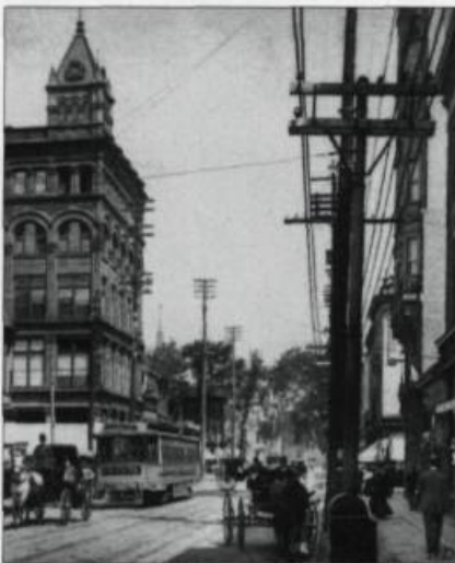
La Belle Époque en est une de révolution technologique. La ville se tisse de fils électriques et les tramways disputent la voie aux voitures à cheval. L'époque est à la vitesse. Carte postale N.D. Phot., 1908, (détail). (Collection Yves Beauregard).

L'enseignement de l'histoire, fortement discuté au cours des derniers mois avec la mise sur pied de la «Commission Lacoursière», vient stimuler cette prise de conscience de la nécessité de connaître ses antécédents nationaux et internationaux. La «Coalition pour la promotion de l'histoire au Québec» dont Cap-aux-Diamants fait partie, invite tous les intervenants du milieu de l'éducation à ramener la connaissance historique dans les programmes scolaires, pour former des citoyens qui connaissent leur provenance collective, bien au fait des lignes de force qui ont forgé leur présent et pour mieux saisir l'évolution de la planète. À une époque de grand rapprochement des cultures et des civilisations, l'histoire joue un rôle déterminant, toutes les histoires. Cap-aux-Diamants apporte sa contribution dans le sens d'une éducation historique nationale populaire depuis 1985.