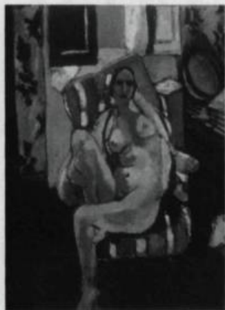
Henri Matisse. «Odalisque avec un tambourin» 1926, huile sur toile; 74,3 X 55,7 cm (Coll. William S. Paley)