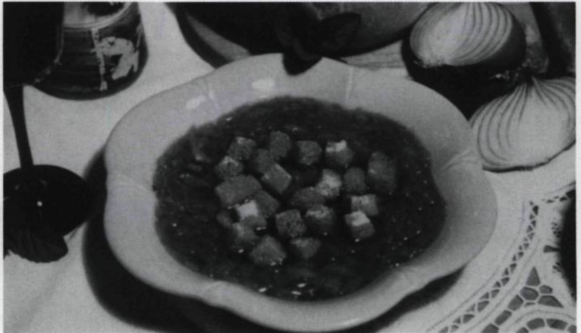
«Soupe à l'ivrogne». Une simple soupe faite à base de consommé de bœuf, d'oignons, de porc salé et de vin, parsemée de croûtons. Carte postale des Éditions André Burtaire, Toronto, 1994. Photo M. E. Erfani. (Coll. Michel Bazinet)

ment jamais de manger nos chiens chauds! Nous sommes aussi notre volonté culturelle : notre melon d'eau ( watermelon ) ou nos chips cèdent peu à peu la place à la pastèque, aux croustilles. Nous créons nos néologismes, comme tartinade , trempe ou rôtis pour ne pas dire toasts (mot anciennement bien français, pourtant, sous sa forme tostes ). Et puis nous sommes nos contradictions, si particulières : d'une part nous résistons au cake si cher à l'Hexagone, d'autre part