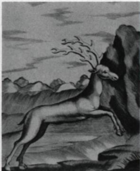
La viande de tous les cervidés de la colonie (orignal, caribou, wapiti et cerf de Virginie) est considérée «délicate au goût».

Bien qu'on relève assez souvent la comestibilité de différentes espèces carni-