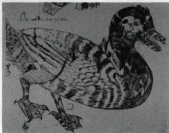
Du gibier à plumes, la sauvagine est la plus grasse et donc de nature plus délicate au goût.

vores, l'enthousiasme et l'unanimité dans les descriptions font défaut. La consommation de la chair des carnivores et des charognards est répugnante pour les Européens mais, dans leur expérience canadienne, la qualité du gras de certaines espèces atténue ce tabou. Le lynx, par exemple, est considéré comme un aliment goûteux lorsque sa chair est grasse. Mais de tous les carnivores, l'ours fait nettement exception. Tous les récits s'accordent sur la qualité de la viande d'ours; elle est «tendre et délicate», «délicieuse», «exquise et excellente». À l'instar du porc, sa grande qualité est son gras. François Dollier de Casson et René de Bréhaut de Galinée, en 1670, en concluent que les ours gras sont de «meilleur goût que les plus savoureux cochons de France». Aussi, la graisse ou huile d'ours (car