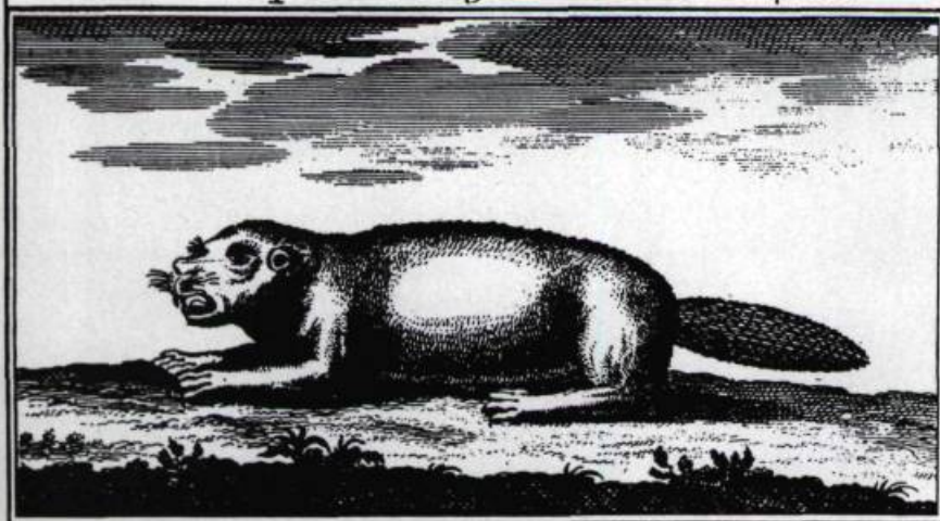
Castor de 26 pouces de longueur entre teste et queue.

«Castor de 26 pouces de longueur entre teste et queue», «trois pieds huit pouces de circonférence» tel que représenté sur une carte géographique, vers 1720.