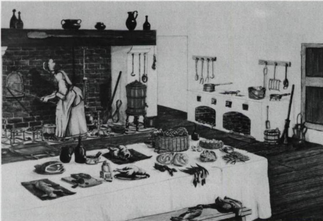
Reconstitution de l'intérieur d'une cuisine de maison bourgeoise du XVIII e siècle. Dessin de Richard Dollard, 1986. (Parcs Canada)

La littérature de voyage avec ses proches parents, les genres épistolaire et autobiographique offrent une source féconde en ce genre de représentation. On y retrouve des compilations riches en notations sur les qualités gastronomiques des plantes et des animaux observés dans le Nou-