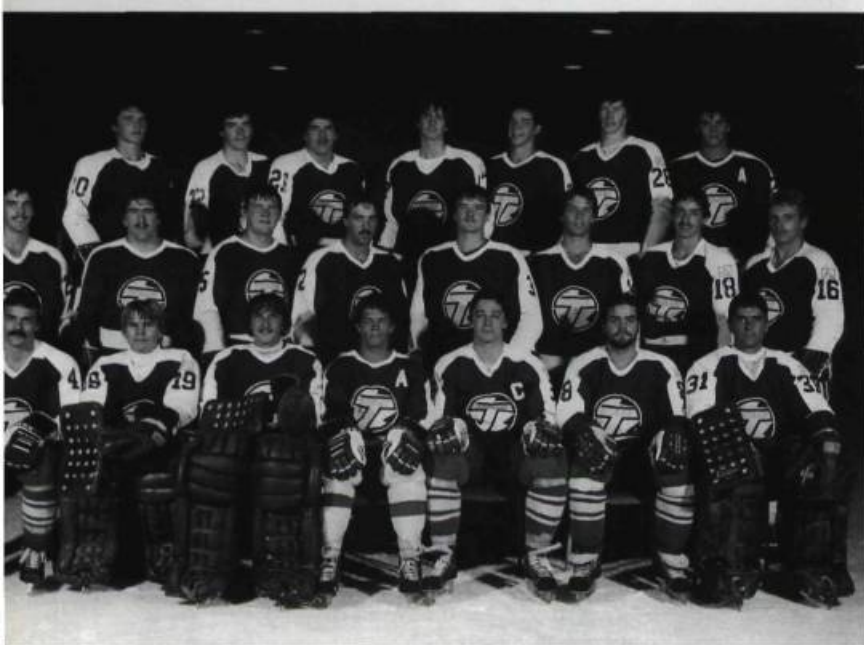
L'équipe de hockey AAA, créée en 1979, disparut en mai 1982. Le chanteur populaire Rock Voisine (en haut à droite) en faisait partie, il portait le chandail numéro 21.

sociale. On en profita alors pour mettre en place et développer de nombreux projets. En 1979, on créa un club de hockey collégial AAA dont fit partie le chanteur populaire Rock Voisine, projet qui prit fin en 1982. Côté culturel, le café étudiant devint, entre 1982 et 1984, le café-théâtre La Passerelle qui servit de lieu de production pour le Théâtre du Repère alors sous la direction de Robert Lepage, où on présenta les pre-