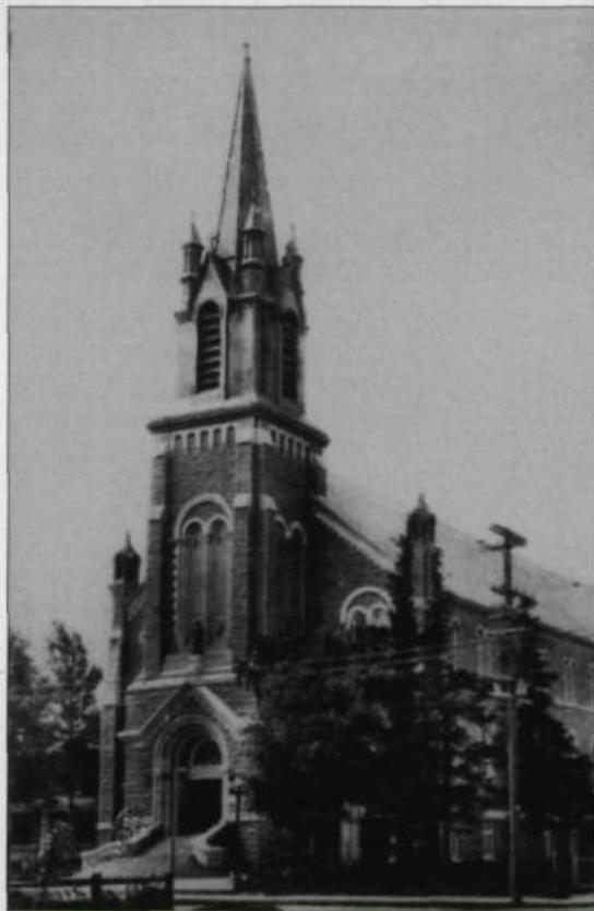
Deuxième église de Saint-Charles ouverte au culte en 1901 et incendiée en 1916. Photographie, 1910. (Archives de la paroisse de Saint-Charles de Limoilou).