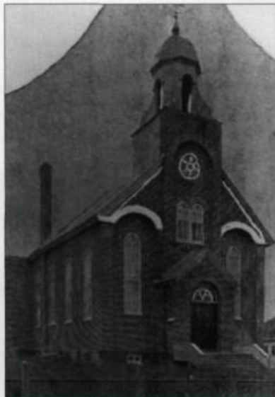
Église de Saint-Zéphirin-de-Stadacona. (Archives de la Ville de Québec; collection iconographique, N-010680).

transept. En effet, le chœur surélevé, mis en évidence dans le film d'Alfred Hitchcock La loi du silence en 1953, a été réalisé selon les plans de l'architecte Adalbert Trudel entre 1917 et 1918.