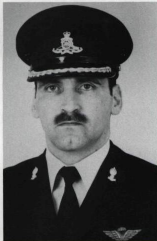
Le major général Roméo Dallaire qui dirigea les Casques bleus au Rwanda en 1993-1994, commanda le régiment d'artillerie francophone de Valcartier de 1983 à 1985.

bellions de 1837 et 1838, leur nombre s'éleva à près de 400 et, entre 1863 et 1869, durant la guerre civile américaine et les menaces d'invasion des Féniciens, ils furent plus nombreux encore. Québec hébergea alors trois compagnies ou batteries complètes et on en comptait neuf autres ailleurs au pays.