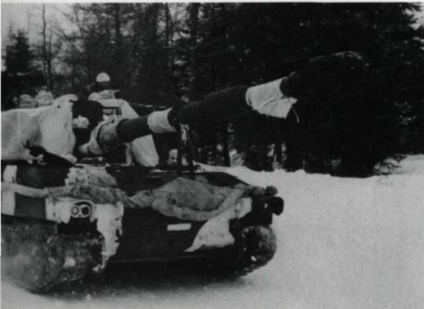
Un obusier de 155 mm M 109 du 5 e régiment d'artillerie légère du Canada durant un exercice à la base de Valcartier (1990).