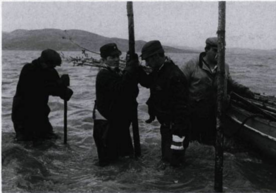
Scène tirée de «Pour la suite du monde» de 1963. Michel Brault a coréalisé ce film avec Pierre Perrault pour le compte de l'ONF.

angulaire plutôt qu'au téléobjectif. Cela soulevait des tas de questions sur l'influence de la présence d'une caméra sur le milieu.