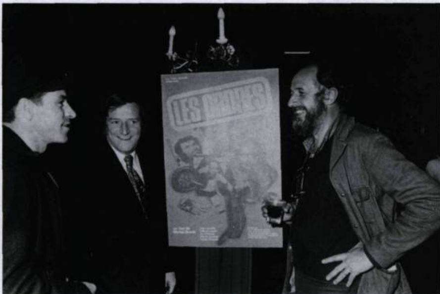
En 1974, Michel Brault réalise, pour les Productions Prisma, le film «Les Ordres» inspiré des événements de la Crise d'octobre 1970. Sur cette photographie prise lors du lancement du film, Brault apparaît (à droite) en compagnie de deux des principaux acteurs, Claude Gauthier et Jean Lapointe.

Il faut le fabriquer pièce par pièce. On a commencé le tournage de Mon oncle Antoine assez tard en hiver. Il n'y avait plus un brin de neige. C'était dégueulasse à Thetford Mines. Une vieille neige sale traînait. J'étais désespéré. L'équipe de production a dû commander 25 camions de neige pour le lendemain matin, premier jour de mars et premier jour de tournage. Le lendemain, au réveil, il y avait un pied de belle neige blanche tombée durant la nuit. On a donc allègrement annulé les camions de neige. On a tourné les scènes d'hiver pendant tout le mois de mars. On a du s'arrêter parce que le financement n'était pas terminé. Il y a eu les élections, une campagne électorale. La première campagne électorale du Parti québécois à laquelle j'ai participé pendant le mois de mai 1970. Puis, on a repris notre tournage au mois de juin. On ne savait même pas si on allait avoir assez de sous pour finir le film! Puis, au montage durant l'été, on s'est aperçu que le film avait certaines lacunes. On ne comprenait pas très bien l'histoire du cercueil, etc. Alors, l'hiver suivant, au mois de décembre, dès qu'il y a eu de la neige, on est retourné à Thetford Mines et on a tourné d'autres scènes. Finalement, on s'est aperçu que le film avait un certain intérêt. Vous comprenez qu'en le faisant on ne savait pas très bien si on allait réussir ou pas. Surtout pas que ce serait un «grand film» comme vous dites. Un film n'existe que lorsque le public le voit.