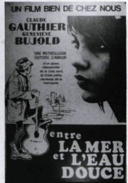
Affiche du film de Michel Brault «Entre la mer et l'eau douce» avec Claude Gauthier et Geneviève Bujold, 1967.

Y.L.: Y a-t-il eu d'autres événements dans l'histoire du cinéma, au sens large, auxquels vous avez participé?