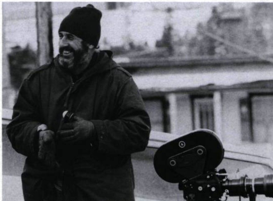
Michel Brault lors du tournage en 1970 du film «Mon oncle Antoine» réalisé par Claude Jutra.

Michel Brault: Une série d'événements heureux ont favorisé ma venue au cinéma direct. Tout d'abord c'est avec Claude Jutra que j'ai appris l'essence même de ce qui fait le cinéma et j'ai eu la chance de faire une partie de ma carrière avec lui. Pour ce qui est de ma façon de filmer, ayant commencé par faire de la photographie, j'avais été influencé par le photographe Henri Cartier Bresson qui ne retouchait jamais les cadrages de ses photos. S'il ratait un moment privilégié ou un geste, il ne demandait jamais à la personne de recommencer, pour ne pas fausser le geste. J'avais entrepris de faire la