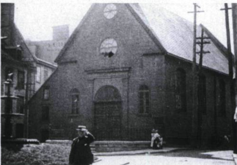
Quelques scènes tirées d'un film sur la ville de Québec en 1918. (Archives de la Cinémathèque québécoise).

avons retrouvé le film dans lequel elle avait tourné en 1912, A Sailor's Heart , et en 1981 nous avons présenté publiquement ce film en présence de l'actrice principale, alors âgée de 85 ans! Nous avons obtenu la collaboration du Château Frontenac qui a accepté gracieusement de loger à nouveau Blanche Sweet, et nous avons même réussi, grâce au curé d'une paroisse de l'île d'Orléans, à dénicher une famille québécoise typique, pour offrir à Blanche Sweet un repas québécois inoubliable, avec bien sûr des pommes de terre bouillies!