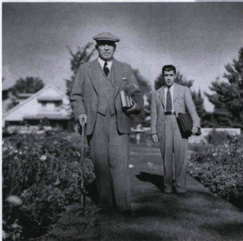
King se promenant dans ses jardins de Moorside.

et les allocations familiales. Sur le plan extérieur, King continue la politique de Laurier et de Robert Laird Borden. Il contribue à garder le Canada sur la voie de l'autonomie face à l'Angleterre. À la suite de l'adoption, en 1946, de la loi abandonnant la citoyenneté britannique, Mackenzie King a l'honneur de devenir le premier citoyen canadien en 1947. Il est aussi l'artisan du rapprochement historique avec les États-Unis. Franklin D. Roosevelt et lui consacreront ainsi la continentalité des intérêts des deux pays.