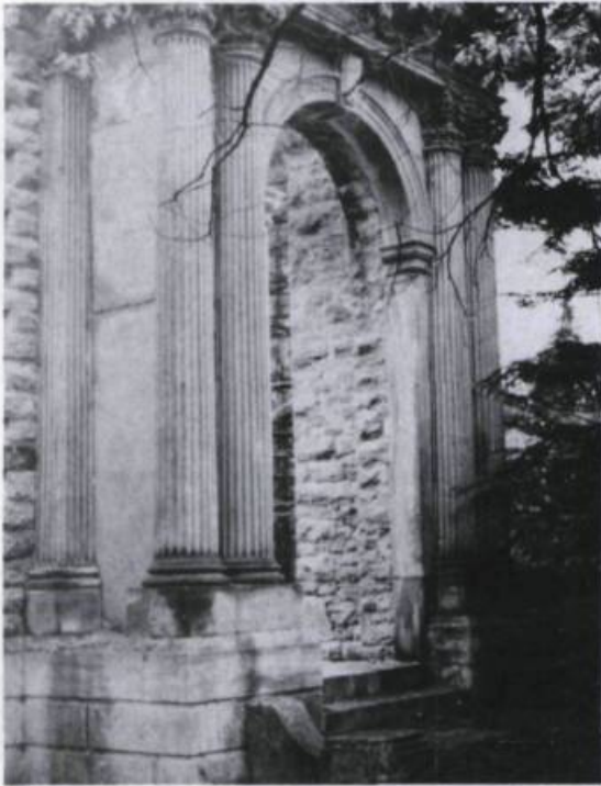
«L'Arc de triomphe» est l'une des fameuses ruines collectionnées par King. Cette pièce architecturale provient de la façade de la North American Bank d'Ottawa. King a fait construire ce monument pour célébrer son retour au pouvoir en 1935.

indélébile de sa personnalité complexe et romantique. Ses jardins, ses collections de ruines et les autres aménagements qu'il réalise témoignent encore aujourd'hui des ambitions et des passions de son architecte. À partir de 1943, il utilise surtout la Ferme, une vieille maison restaurée où il passe le plus clair de ses temps libres. C'est dans cette résidence que le vieux politicien malade et usé meurt en 1950, à peine deux ans après avoir transmis le pouvoir à son dauphin, Louis Saint-Laurent.