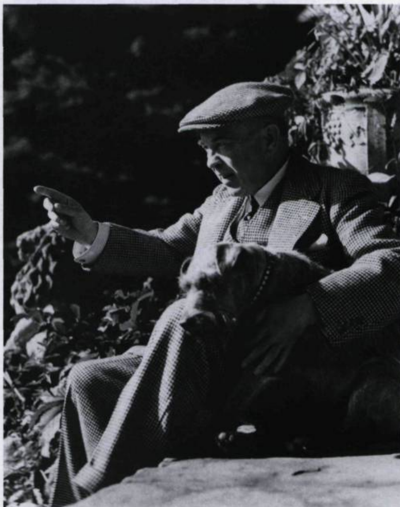
William Lyon Mackenzie King et son chien Pat.

Travail, il en est le premier titulaire. Il a été nommé à ce poste grâce à sa formation exceptionnelle pour l'époque. Docteur en économie et spécialiste en relations de travail, King est le seul premier ministre canadien à avoir détenu un si