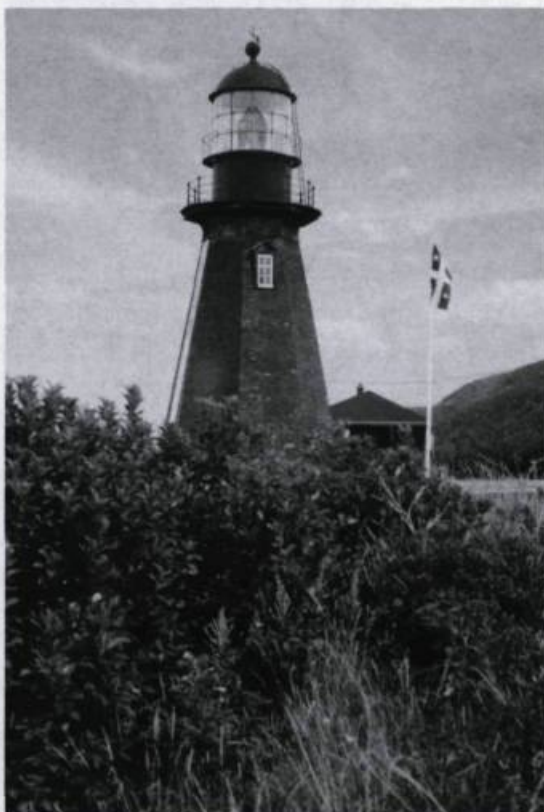
Phare de Rivière-à-la-Martre (Gaspésie). (Archives de l'auteur).

Le phare fut d'abord occupé par le comte Henri de Puyalon, né au château de l'Orb, près de Bordeaux. Marié à Angéline Ouimet, fille d'un ex-premier ministre du Québec, le comte de Puyalon, en plus de surveiller le phare, écrivait des