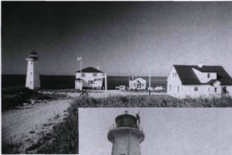
Anticosti, île du golfe Saint-Laurent qui possède plusieurs phares dont ceux de Carleton, Bagot Bluff... (Archives de l'auteur).