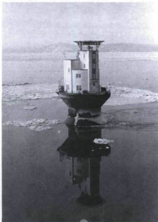
Phare-pilier de l'île Blanche en face de Rivière-du-Loup. (Archives de l'auteur).

récits sur la vie au Labrador et des livres sur la chasse.