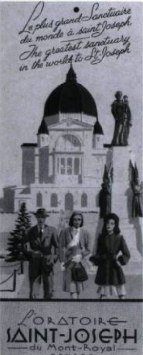
Dépliant promotionnel de l'Oratoire Saint-Joseph de Montréal, vers 1955.

des chapelets en 1879, pont de glace qui s'est formé sur le Saint-Laurent à la fin de mars et qui a permis de transporter durant huit jours la pierre nécessaire à la construction de la nouvelle église du Cap, le prodige des yeux en 1888, où la statue de la Vierge, dont les yeux étaient fermés, les ouvre pendant dix minutes environ. Des Annales sont fondées en 1892 et, en 1902, le pèlerinage est confié à la congrégation des oblats de Marie-Immaculée. Il atteint sa maturité en 1904, alors que le pape accorde le privilège du couronnement à la statue.