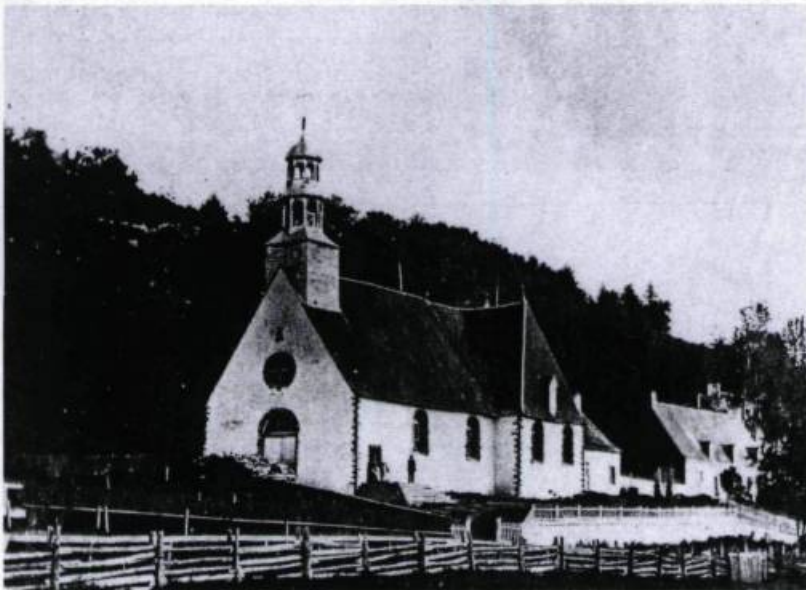
Fondée vers 1658, Sainte-Anne-de-Beaupré est le plus ancien lieu de pèlerinage du Québec. Ici l'église construite en 1676. (Collection privée).

C'est surtout en bateau, cependant, qu'on vient à Sainte-Anne-de-Beaupré. En 1872, les évêques du Québec publient un mandement collectif sollicitant le soutien des fidèles pour la construction