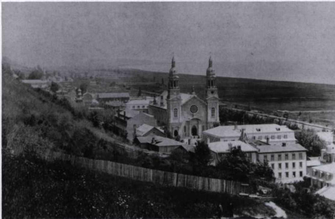
Érigée en 1872, la quatrième église de Sainte-Anne-de-Beaupré devint la première basilique en 1887 et fut incendiée le 29 mars 1922. Photo: Louis-Prudent Vallée, vers 1888. (Coll. Jean-Marie Lebel).

d'une nouvelle église. C'est le début d'un mouvement officiel où tout le Québec est associé au pèlerinage. Ce mouvement connaîtra son point culminant en 1876, alors que sainte Anne est proclamée patronne de la province de Québec. La création des Annales de la Bonne Sainte-Anne de Beaupré en 1873 contribue puissamment à répandre la dévotion. Le nombre de pèlerins va sans cesse croissant: on en compte 40 000 durant l'été 1877. Les prêtres séculiers ne pouvant plus suffire à la tâche, M gr Elzéar-Alexandre Taschereau, archevêque de Québec, décide de confier le sanctuaire à une congrégation religieuse: les rédemptoristes belges prendront charge du sanctuaire en 1879. Jusqu'à la fin du siècle, celui-ci connaîtra un essor considérable. En 1887, Taschereau, devenu le premier cardinal canadien, couronne la statue de la sainte en présence de huit évêques, 250 prêtres et 10 000 fidèles. Autre manifestation du même genre en 1889, à l'occasion de la consécration de la basilique. Avec l'arrivée du chemin de fer en 1889, le nombre de pèlerins grimpe à 100 000; il y a alors plus de cent pèlerinages organisés par année. En 1892, l'arrivée de la Grande Relique — une partie du bras de sainte Anne ramenée de Rome par M gr Calixte Marquis — fut un autre événement de grande envergure.