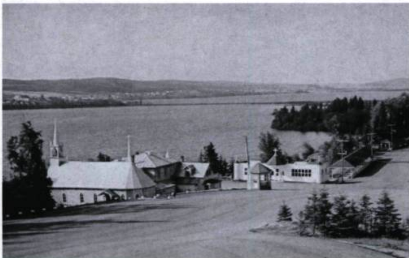
Pèlerinage à Notre-Dame de Lourdes et à Saint-Antoine, Lac-Bouchette, au sud du lac Saint-Jean. Carte postale d'Alex Wilson. (Coll. Jean-Marie Lebel).