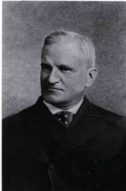
Francis Parkman en 1889. (Charles Haight Farnham. «A life of Francis Parkman». Boston: Little, Brown and Company, 1902).

Ses longues randonnées dans les bois avaient ruiné sa santé. La lumière du soleil lui devint souvent insupportable. Ses problèmes visuels ne lui permettaient pas de lire ou d'écrire plus de quelques minutes d'affilée. Des migraines l'importunaient. Il se plaignait de sentir un bras de fer lui serrer la nuque. Il dut combattre presque toute sa