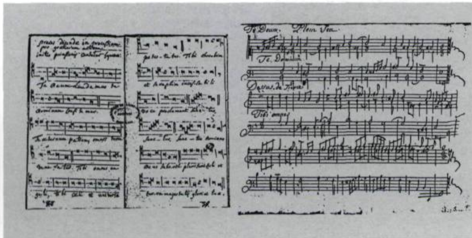
«Te Deum» tiré d'un recueil d'hymnes. (Archives du Séminaire de Saint-Sulpice, Montréal).