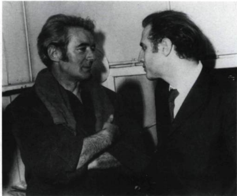
Les deux géants de la chanson du Québec: Félix Leclerc et Gilles Vigneault (1967).

C'est dans cette fertilité bouillonnante qu'apparaît, vers 1960, le phénomène généralisé des boîtes à chansons. Grande bénédiction culturelle, artistique et sociale qui coïncide avec l'émergence de notre «Révolution tranquille».