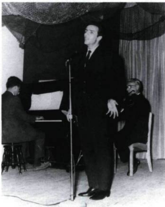
Gilles Vigneault à ses débuts dans une boîte à chansons décorée de filets de pêche (1960). (Photo: F. Gariépy).

Dès 1960, des boîtes de prestige comme «la Boîte à chansons de la porte Saint-Jean» (Vieux-Québec) ou la «Butte-à-Mathieu» (Val-David) existent. Une troisième, d'envergure, «le Patriote» (Montréal), apparaît plus tard. Mais, même pour les boîtes plus modestes et moins renommées, l'imagination est au pouvoir et nous assistons à une véritable prolifération bienheureuse, autant pour la débrouillardise d'organiser un local pittoresque que pour la créativité de lui trouver un nom.