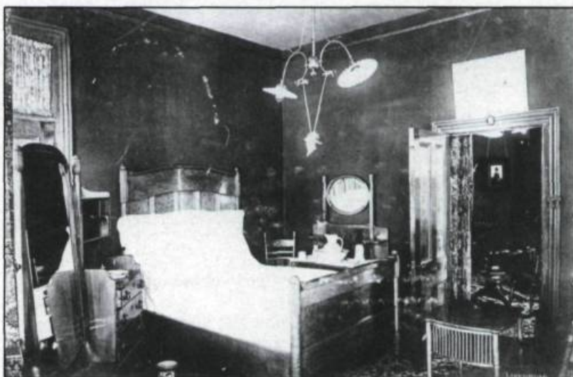
«Salon, salle à manger et chambre à coucher à l'Hôtel Roberval en 1895».

Mais les ressources du lac ne suffisaient peut-être pas aux pêcheurs, ou alors Beemer était un homme très prévoyant. Ainsi, «pour assurer la survie de ce poisson fragile qui se reproduit difficilement, écrivent Girard et Perron, Beemer ne ménagea rien et va jusqu'à aménager, en 1897,