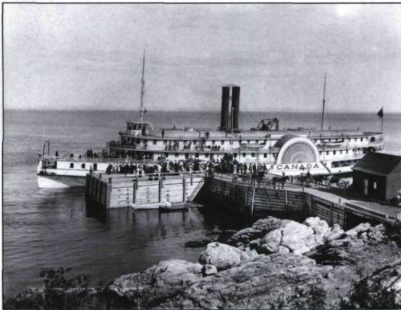
«Le vapeur Canada arrivant à Cap-à-l'Aigle en 1895». Les arrivées et les départs des bateaux blancs aux stations de villégiature donnent lieu à un achalandage particulier. Les grands hôtels offrent des services de transport hippomobile, le premier signe d'hospitalité.

lancé à Lauzon en 1927, le Québec et le Tadoussac mis à l'eau l'année suivante dans le même chantier, emportent chaque beau jour des groupes de 300 à 500 passagers vers des paysages idylliques. Aux trois-ponts à roues à aubes du XIX e siècle succèdent des palais flottants de 5 étages mus cette fois par des hélices, une innovation appliquée au pays depuis 1911 avec la mise en service du Saguenay.