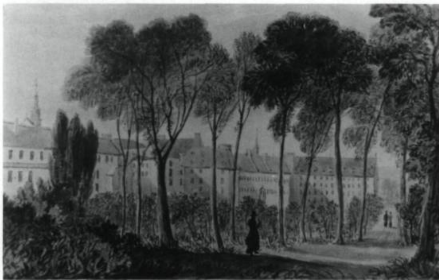
«Québec à la fin du XVII e siècle». Les édifices du Séminaire de Québec apparaissent (H et E) du côté droit.

Fin de l'enseignement à la Grande Ferme. Jusqu'à la Conquête, ce sera un lieu de repos et