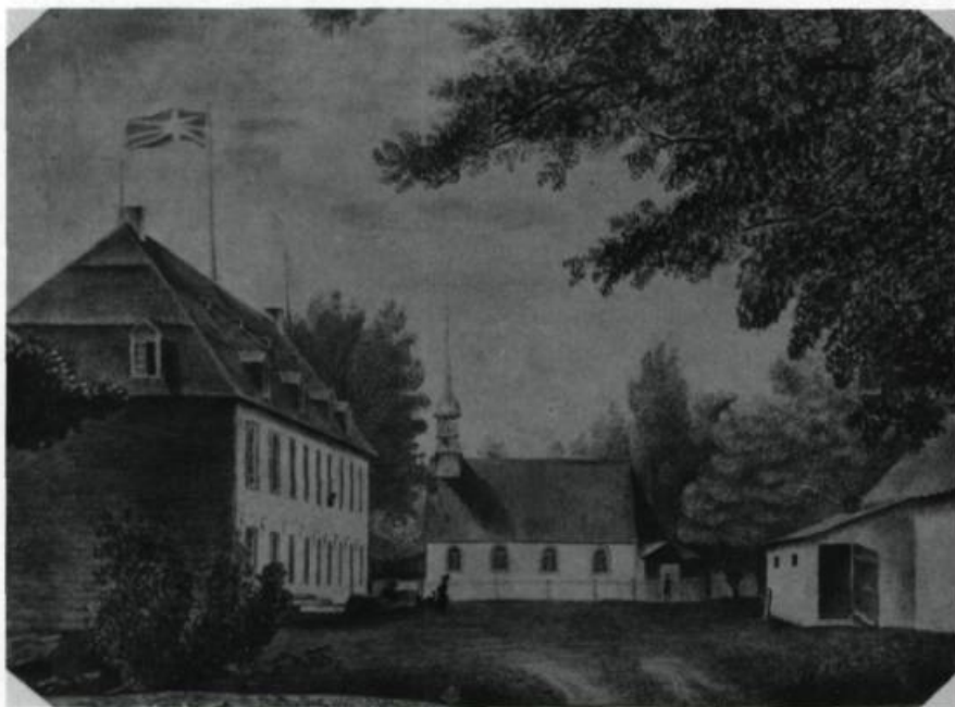
Le Petit-Cap à Saint-Joachim. Le château Bellevue et la chapelle. Dessin au crayon de l'abbé Charles-Honoré Laverdière, avant 1870. (Archives du Séminaire de Québec).

Construction des trois lanternes surplombant le pavillon central qui abrite aujourd'hui la section collégiale du Petit Séminaire.