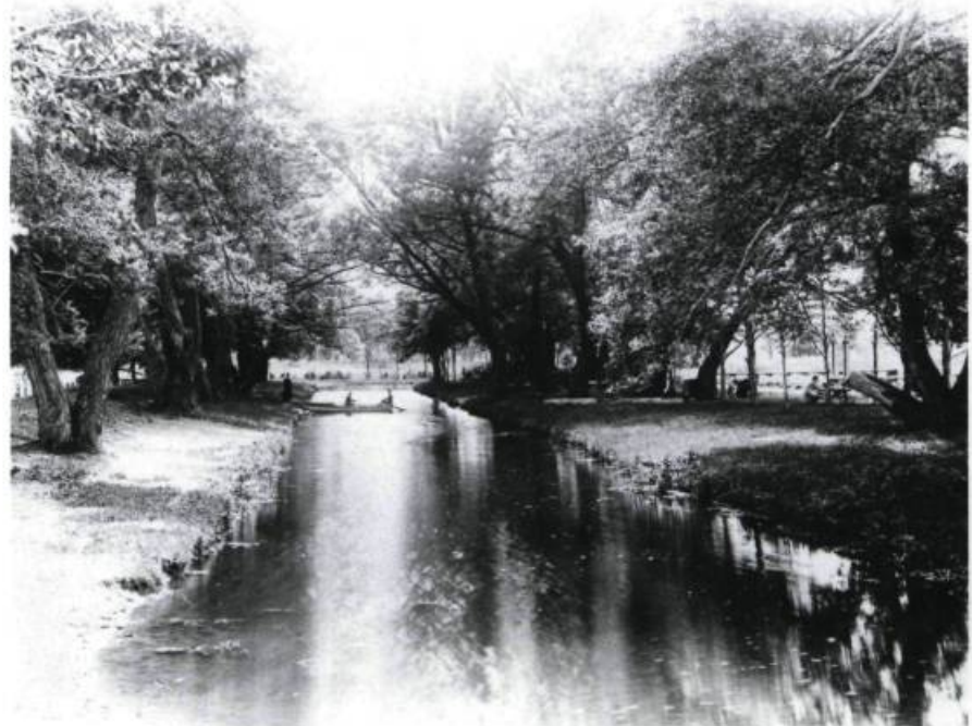
Vue de l'étang du domaine de Maizerets en juillet 1912.