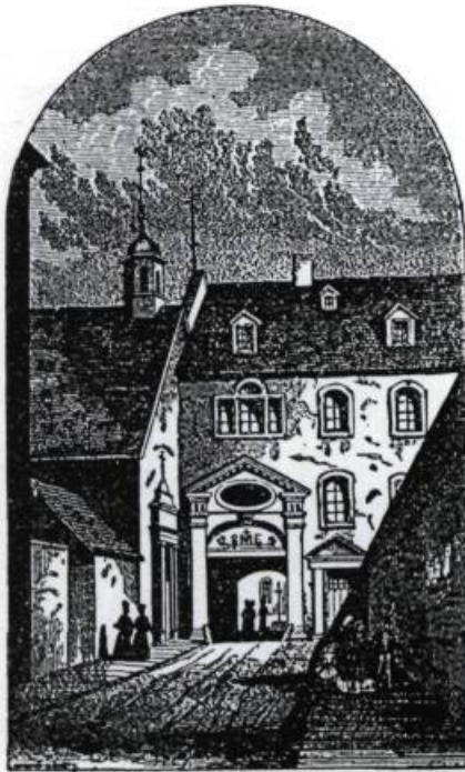
Porche de l'aile de la Congrégation vers 1858-1859. Du côté gauche, on voit la chapelle du séminaire construite en 1750-1752 et détruite par un incendie en 1888.