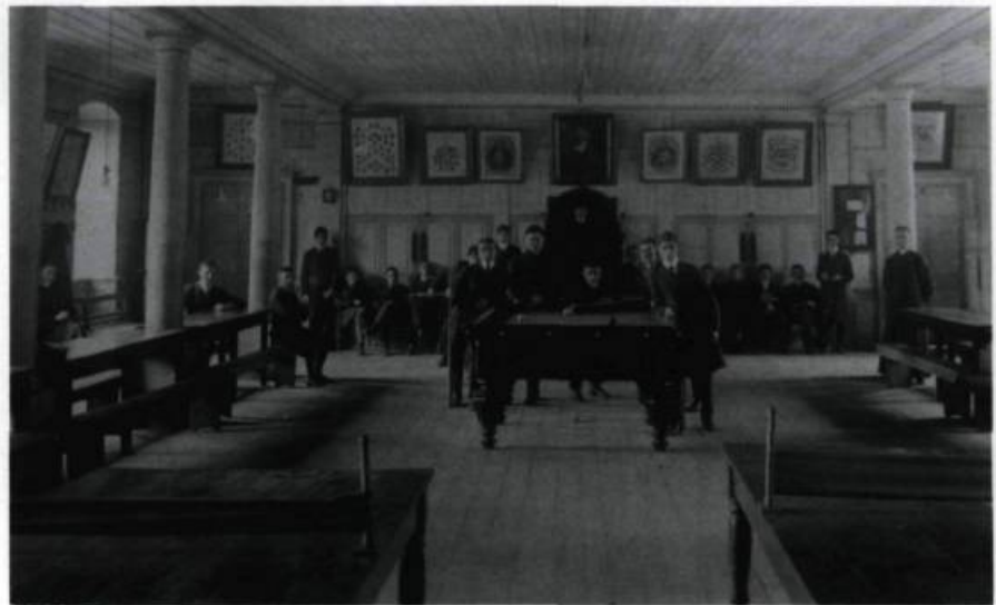
Salle de récréation des «Grands». Carte postale photographique, vers 1910.

Le Petit Séminaire est constitué par lettres patentes en corporation distincte. Le conseil d'administration est composé de sept membres, tous des prêtres œuvrant au Petit Séminaire.