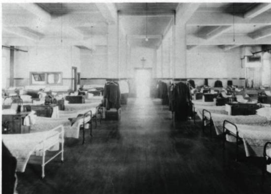
Les dortoirs du Petit Séminaire de Québec.

Création de la fanfare, appelée Société Sainte-