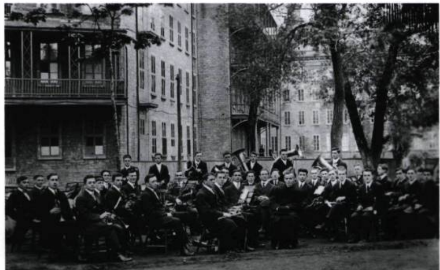
Fanfare du Petit Séminaire de Québec. (Académie Sainte-Cécile). Photo prise pendant l'année scolaire 1915-1916.