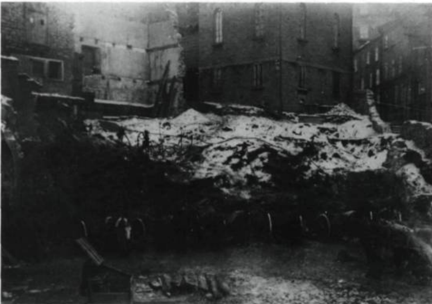
Débuts des travaux de construction du Pavillon des classes ou Maison neuve, sur la rue Sainte-Famille, vers octobre 1919.

L'équipe de natation du Petit Séminaire reçoit pour la troisième année consécutive le trophée de la Fédération des activités sportives collégiales du Québec.