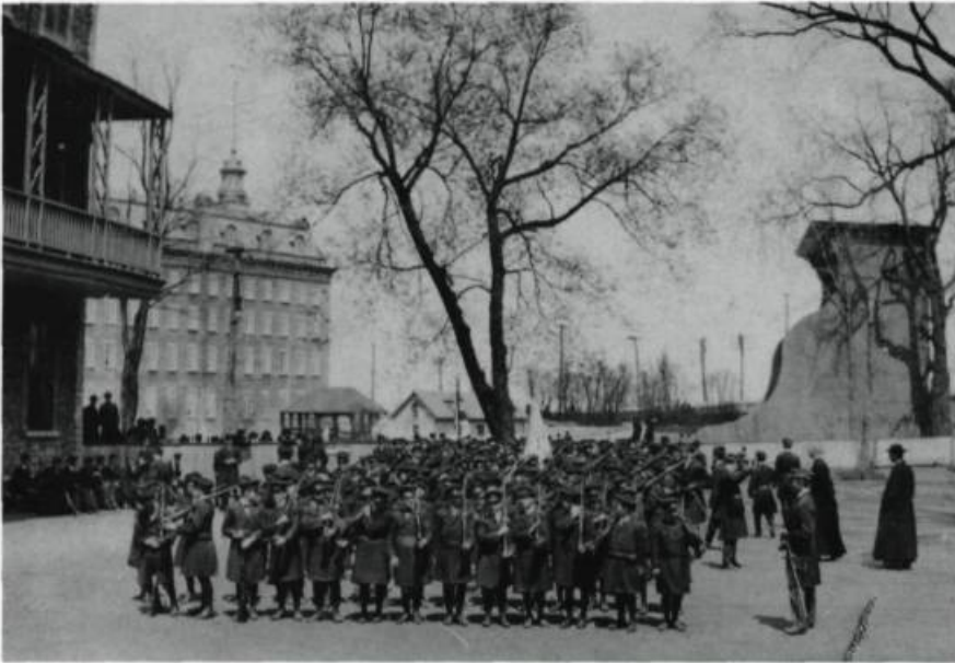
Démonstration des cadets du Petit Séminaire de Québec dans la cour des «Grands» vers 1915.