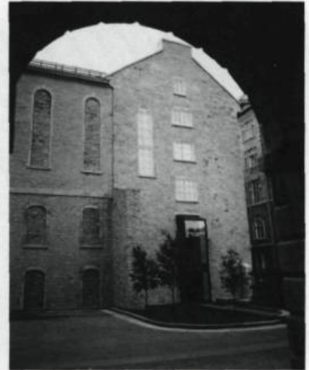
Pensionnat de l'université, puis couvent, l'édifice situé au 9, rue de l'Université abrite depuis 1984 le Musée du Séminaire de Québec et ses riches collections. (Archives de «Cap-aux-Diamants»).