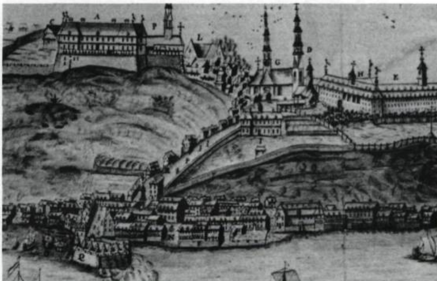
Le Séminaire de Québec et ses jardins vers 1830. Aquarelle de James Pattison Cockburn. (Royal Ontario Museum, Toronto).

M re de Laval donne tous ses biens au Séminaire.