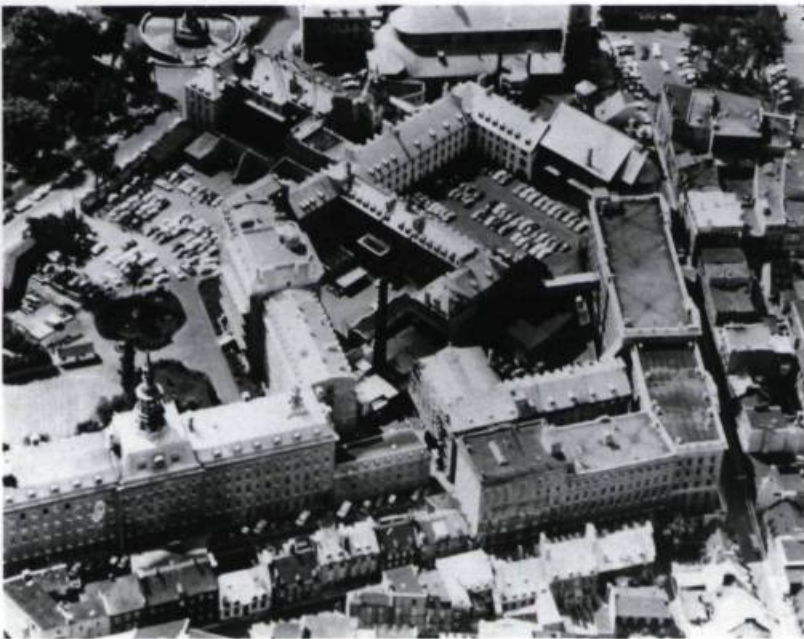
Vue aérienne de l'ensemble des bâtiments du Séminaire de Québec et de l'Université Laval en 1950..

L' ÉCOLE D'ARCHITECTURE A RAMENÉ L'UNIVERSITÉ Laval à son berceau en aménageant en 1990 dans les anciens locaux, restaurés, du Petit Séminaire. Par un curieux chassé-croisé, le Petit Séminaire se retrouve actuellement dans les bâtiments originaux de l'université.