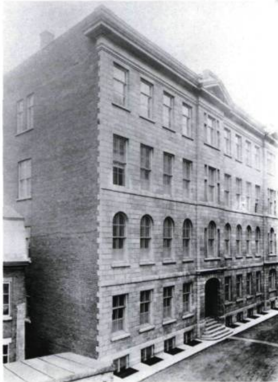
En 1922, Jean-Siméon Bergeron propose des plans pour agrandir l'École de médecine. (Division du Vieux-Québec, Ville de Québec).

construction devait, à la limite occidentale des terrains du Séminaire, marquer une fois pour toutes la présence de l'institution dans le Vieux-Québec.