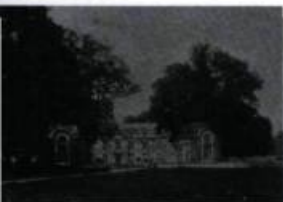
Montigny-sur-Avre (Eure-et-Loire). Le château de Montigny où naquit François de Laval le 30 avril 1623. (Almanach de l'Action sociale catholique, 1924).

Il confie aux prêtres du Séminaire de Québec la direction d'un Petit séminaire pour recevoir des jeunes garçons et «les disposer à l'état ecclésiastique».