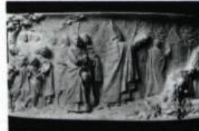
Bas-relief du monument Laval montrant une «Procession historique où figurent les représentants de l'ordre religieux et civil de la Nouvelle-France». Carte postale de l'éditeur Neurdein, Paris, vers 1907. (Collection Yves Beau-regard).

M sr de Laval meurt des suites d'une engelure contractée le Vendredi Saint à la cathédrale. Il venait d'avoir 85 ans.