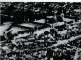
Vue générale du collège de La Flèche où François de Laval poursuit des études de 1631 à 1641.