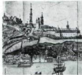
Sur ce cartouche d'une carte de Jean-Baptiste-Louis Franquelin de 1688 apparaît du côté droit le Séminaire fondé par M sr de Laval en 1663. (Archives de Cap-aux-Diamants).