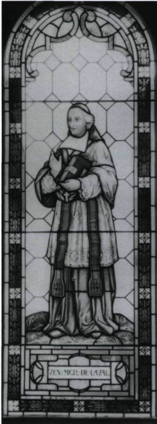
Vitrail offert à la chapelle extérieure du Séminaire de Québec par l'abbé J.A. Laflamme en 1904.

M sr de Laval traverse en France pour hâter l'érection de l'évêché de Québec, car les problèmes qu'il éprouve lui font comprendre qu'il a besoin d'une autorité plus grande que celle d'un vicaire apostolique.