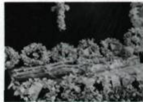
Les restes de M sr de Laval présentés au public avant la translation officielle du 23 mai 1878. Photo de Jules-Ernest Livernois, 1878. (Collection initiale. Archives nationales du Québec à Québec).