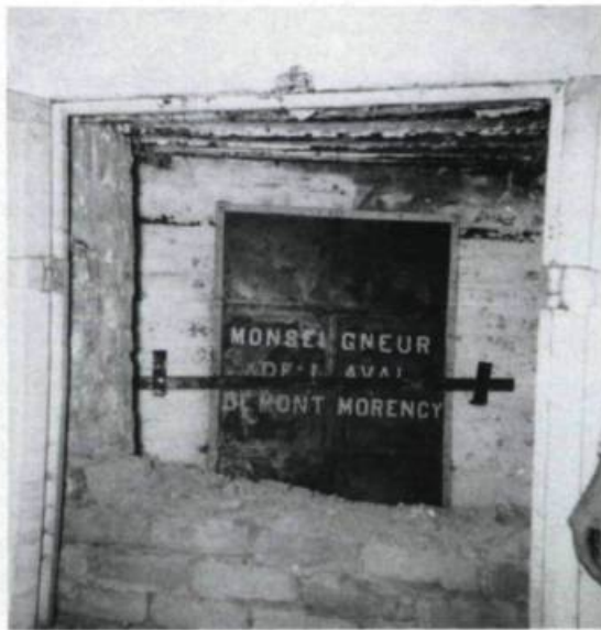
Portes du caveau dans la crypte de la chapelle du Séminaire où reposent les restes de M re de Laval de 1878 à 1950.

M re de Laval fut inhumé dans les caves de la cathédrale. On y enterrait prêtres et laïcs depuis 1651. La cathédrale, étant construite sur le roc, les inhumations s'avéraient difficiles. C'est pourquoi M re de Laval avait stipulé en 1661 que les familles devaient faire creuser, à leurs propres dépens, une fosse d'une profondeur adéquate. Plus de 900 personnes y furent inhumées de 1651 jusqu'à nos jours (on n'y enterre plus de laïcs depuis 1877).