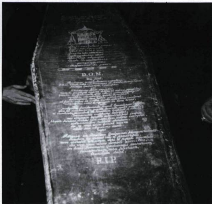
En 1878, les restes de François de Laval sont placés dans un nouveau cercueil de plomb qui comportait de longues inscriptions.

ainsi que mourut M sr de Laval le 6 mai 1708, à sept heures et demie du matin, au moment où l'on récitait à ses côtés l'oraison de la Sainte-Famille. En se rendant à l'office du vendredi saint, «par un des plus grands froids qu'il se puisse faire en Canada» comme le soulignait le frère