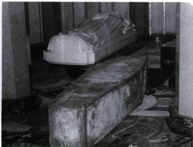
Dans la chapelle funéraire de 1950, l'on aperçoit au premier plan le cercueil de plomb de 1878 et au second plan, le gisant de marbre réalisé par Francesco Nagni. (Archives du Séminaire de Québec).

Québec, les cercueils de M sr de Laval et de M sr François-Louis Pourroy de Lauberivière (celui-ci était décédé en 1740 peu de jours après son arrivée à Québec), furent transportés trente pieds plus loin, au-dessous de la première marche du nouveau maître-autel et placés, «les pieds tournés vers la nef», dans le même ordre qu'auparavant: M sr de Laval du côté de l'Évangile, et M sr de Lauberivière du côté de l'Épître. Trois os des vertèbres du corps de M sr de Lauberivière furent retirés, mais rien nous indique que l'on ouvrit le cercueil de M sr de Laval. Plus tard, lors de la reconstruction au lendemain de la Conquête, le maître-autel fut de nouveau reculé, mais on ne se préoccupa point de déplacer aussi les cercueils des évêques. Et c'est à l'endroit où ils avaient été placés en 1748 qu'ils furent retrouvés le 19 septembre 1877.