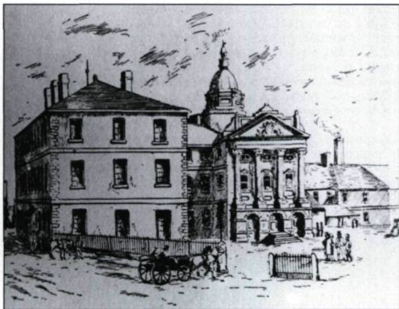
Le parlement du Bas-Canada vers 1835. À droite, apparaît l'aile construite sous la direction de Thomas Bailly en 1831. La porte centrale, coiffée d'un dôme, est l'œuvre de l'architecte Louis-Thomas Berlinguet (1833).

Mais le malheur guettait. En 1849, l'agitation politique tourna au drame. La population anglophone, déjà mécontente des politiques économiques de la Grande-Bretagne, protesta contre la loi qui indemnisait les citoyens du Bas-Canada victimes des répressions militaires de 1837-1838. Le 25 avril, les manifestations tournèrent à l'émeute et la foule en colère attaqua le parlement et l'incendia. Ce sinistre entraîna une perte totale non seulement de l'édifice mais aussi de la bibliothèque, d'une partie des archives, des meubles et des tableaux de grande valeur appartenant à la législature.