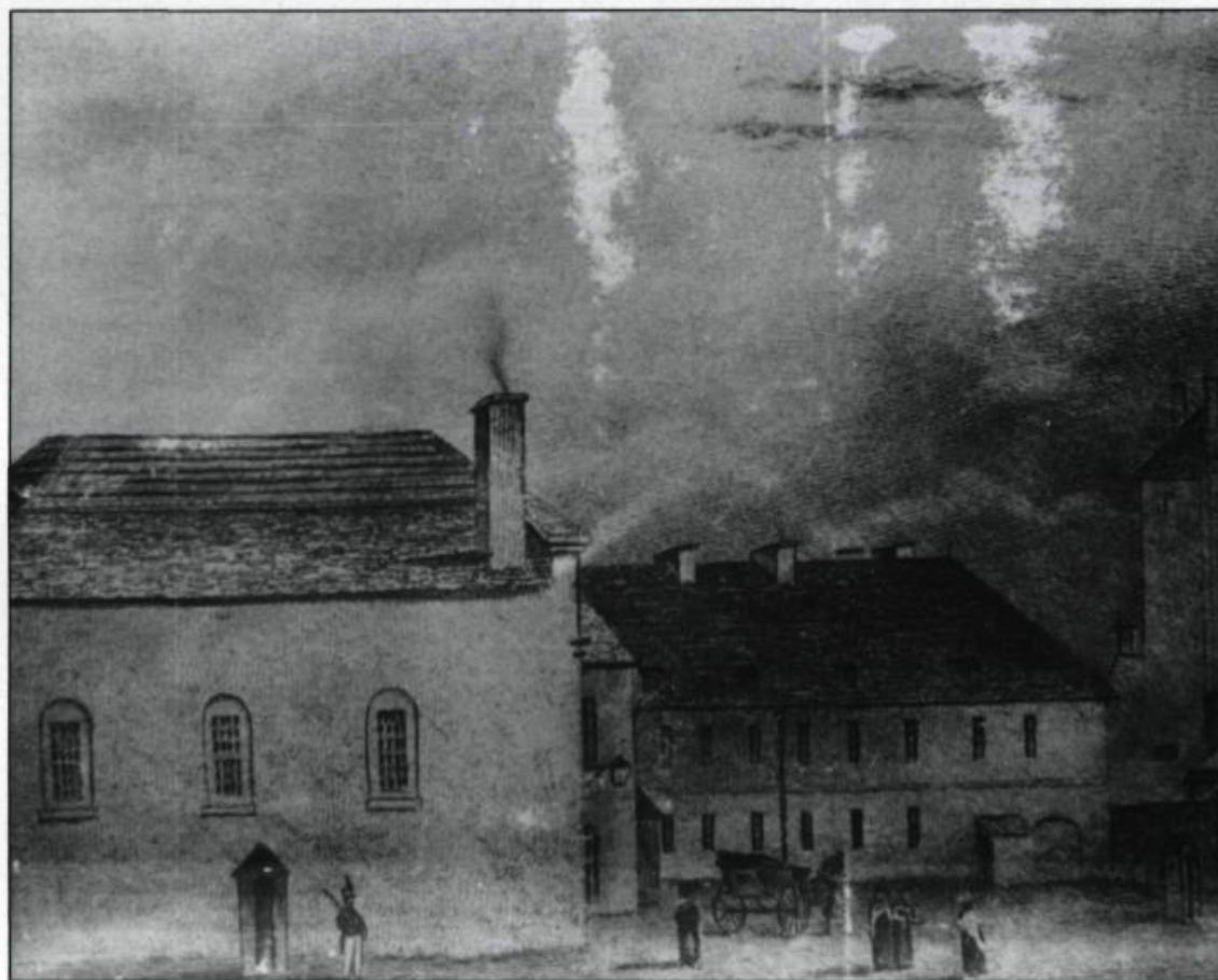
En 1792 le premier Parlement bas-canadien s'installe dans la chapelle et le palais épiscopal désaffectés. (Gravure de James Smillie, 1829. Archives nationales du Québec à Québec).

À Montréal, le Parlement s'installa dans l'édifice du marché Sainte-Anne qui était vaste, bien construit et très commode. Il fit l'unanimité des parlementaires qui se félicitèrent d'avoir ainsi choisi Montréal comme capitale.