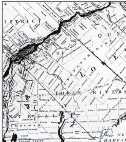
«A new Map of the Province of Lower Canada», 1802. Samuel Holland, Londres.

En principe, le township se présente comme un rectangle de 16 kilomètres de côté divisé en bandes rectilignes d'environ 1,6 kilomètre de profondeur, composées de 28 lots de 200 acres chacun, comprenant les allocations pour les chemins dont le gouvernement ne se portait nullement responsable. En réalité, on trouve beaucoup plus de formes irrégulières à cause des principales assises retenues au cours de l'arpentage, soit la frontière américaine et la rivière Saint-François. Cependant, c'est le problème de la disposition des réserves du clergé et de la couronne qui allait freiner tous les plans d'expansion de la colonisation et du peuplement. En les intercalant à travers les lots des concessionnaires, on entravait la construction des routes et leur entretien alors à la charge des habitants et on ajoutait aux frais de clôture, de drainage et autres travaux de mise en valeur. La cohésion entre les établissements risquait d'être rompue par ces lots dont l'occupation restait aléatoire.