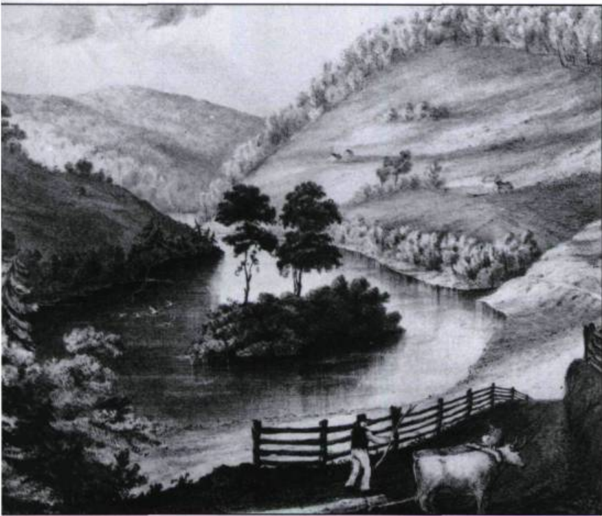
«View of the Eastern Townships, Lower Canada» par Joseph Bouchette. British American Land Co. Views in Lower Canada, 1836. Planche n° 5.

Bien que la proclamation n'avait donné aucune indication précise de la position géographique de ces terres, le choix de la zone au sud du Saint-Laurent s'était imposé à cause de la proximité des frontières et par l'insistance de nombreux loyalistes et autres Américains, réfractaires au régime seigneurial, qui voulaient s'y