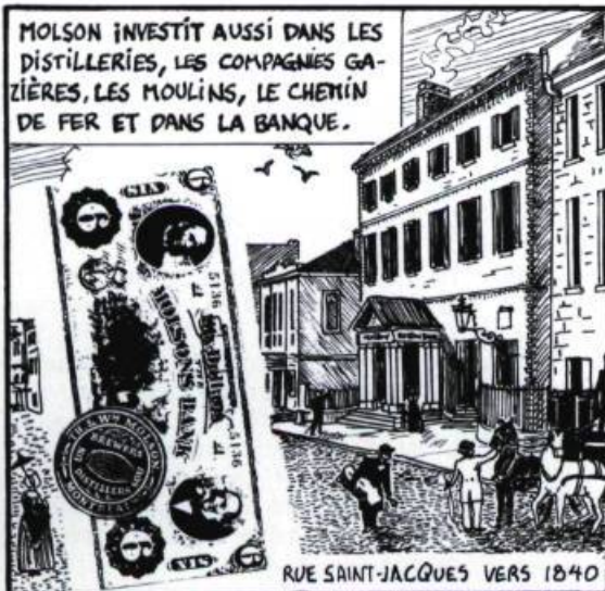
RUE SAINT-JACQUES VERS 1840

MOLSON INVESTIT AUSSI DANS LES DISTILLERIES, LES COMPAGNIES GAZIÈRES, LES MOULINS, LE CHEMIN DE FER ET DANS LA BANQUE.