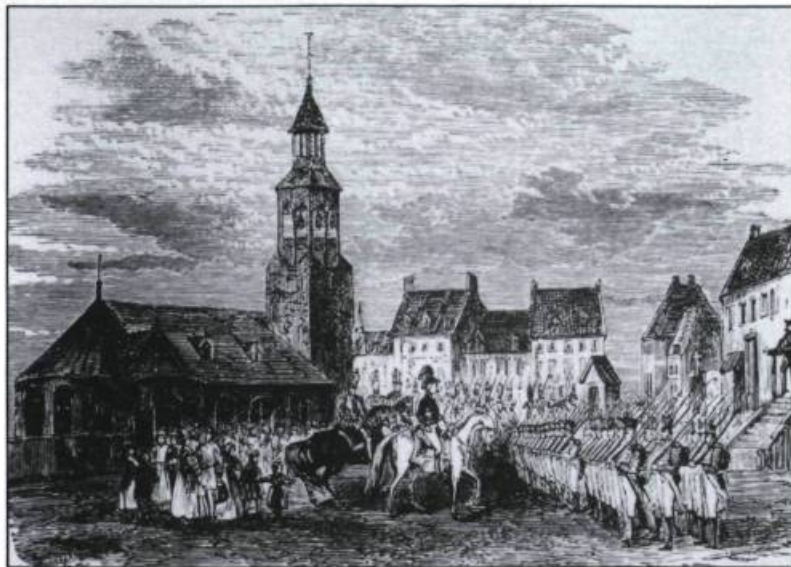
Scène militaire à Montréal en 1775 lors de l'invasion américaine.