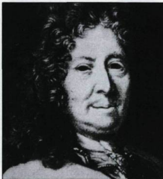
Philippe de Rigaud, marquis de Vaudreuil. Il était gouverneur général de la Nouvelle-France lors de la seconde installation française au Témiscamingue.