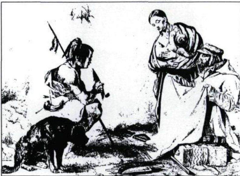
Scène de troc chez les Amérindiens. (Coke Smith, Archives nationales du Canada, Ottawa. C-1026).

A U XVII e SIÈCLE, LES FOURRURES REPRÉSENTENT LA totalité des exportations canadiennes. En 1739, elles comptent encore dans une proportion de 70%. La traite des fourrures, par la place qu'elle occupe dans les exportations coloniales, constitue l'épine dorsale de l'économie de la Nouvelle-France. La création de Montréal, à l'extrémité de la voie navigable du Saint-Laurent, et surtout sa croissance au cours du Régime français s'expliquent par ce commerce. Les historiens ont souligné la formation, à Montréal, d'une classe bourgeoise qui tire sa force économique de la fourrure. Quelques Montréalais orientent vers le Témiscamingue une grande part de leurs activités commerciales démontrant ainsi les avantages qu'ils y trouvent. Une évaluation de la fin du Régime français estime à 2% seulement la production pelletière canadienne en provenance du Témiscamingue. Là comme ailleurs, l'exploitation de la pelleterie repose sur le troc. En échange des fourrures recueillies par les Amérindiens, les voyageurs leur remettent