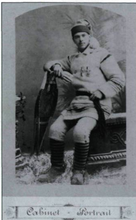
Un raquetteur de Québec posant avec fierté dans son costume inspiré de celui des coureurs de bois de jadis.

Un sifflet à vapeur se fait entendre. À onze heures, le train tant attendu entre en gare. Sous les acclamations, le gouverneur général Lord Aberdeen est accueilli par un tout jeune enfant, revêtu d'un costume de raquetteur, qui lui donne solennellement un bouquet orné de raquettes miniatures et de rubans aux couleurs des divers clubs de la ville.