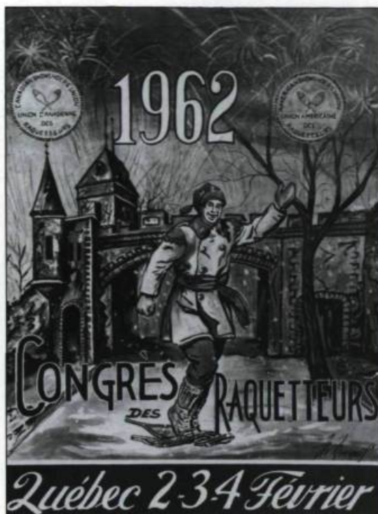
Page couverture du programme souvenir émis à l'occasion du Congrès des raquetteurs de 1962, dernier soubresaut de l'histoire de la raquette à Québec. (Oeuvre de M. Marquis, collection Yves Beauregard).

Parmi les clubs de la région de Québec qui s'illustrent au cours du xx e siècle jusqu'au congrès de 1962, dernier soubresaut du monde québécois de la raquette, notons: le club Le Zouave, fondé en 1906 par les «soldats du pape» et transformé en Union Saint-Laurent en 1940, le Loretteville organisé en 1925, le Voltigeur de Lévis dont les origines remontaient à 1885. Au congrès de 1962 participent aussi deux vieux clubs de Québec du xix e siècle qui, ayant traversé quelques tempêtes, ont tenu le coup jusque là: le Frontenac et les Amateurs de raquette de l'Union Commerciale. Ce congrès, que l'on dit «interna-