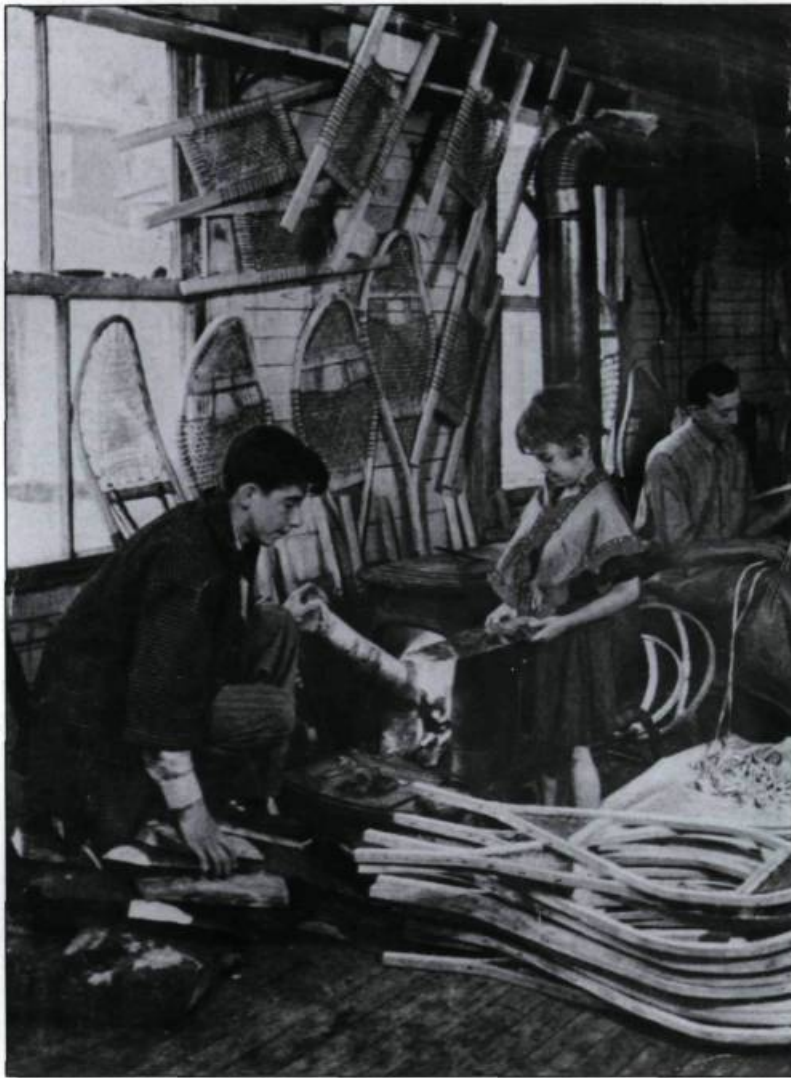
Faite d'une armature de frêne et de lacets de babiche (cuir de vache), la confection des raquettes constitue un art que les Amérindiens se transmettent de génération en génération. Ici, l'intérieur de l'atelier de Bastien Frères, au Village Huron de la Jeune-Lorette.

gnomes». Québec est en fête. Jamais les raquetteurs de la cité de Champlain n'ont connu jours plus glorieux que durant ce carnaval de 1894. Courses, processions aux flambeaux, animation des chars allégoriques du défilé, attaque et conquête du château de glace, les raquetteurs sont partout. Lord Aberdeen revêt lui aussi un costume de raquetteur lors du grand défilé.