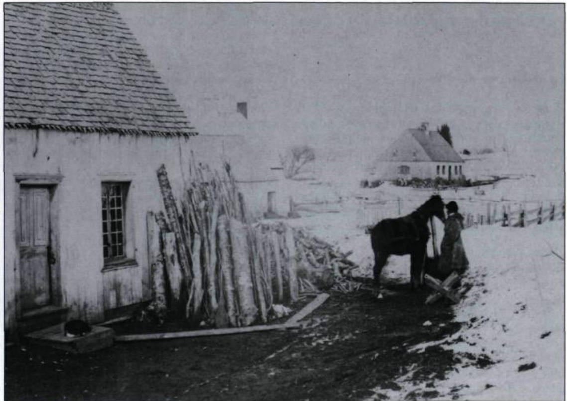
Une maison de l'île d'Orléans en 1858. Encore proche du modèle des origines, celle-ci est couverte de planches verticales et son toit est de bardeau. Le bois de chauffage se trouve à portée de la main. La maison au second plan est déjà plus spacieuse avec sa cheminée centrale. «Habitant Cottage Lower Canada». Photographie de Samuel McLaughlin, 1858. (Collection de l'auteur).

mentionnent aucun jeux de cartes, de dames ou d'échecs. Pas de jouets non plus pour les enfants. La lecture semble peu pratiquée, car à peine une quinzaine d'inventaires après décès (sur 102) signalent la présence d'un ou deux livres, des ouvrages de dévotion pour la plupart. Quant à l'écriture, les documents révèlent que seulement trois habitants possèdent du papier ou de l'encre, sans doute plus pour consigner leurs transactions d'affaires que pour tenir un journal, un livre de raison ou pour entretenir une correspondance. Aucun instrument de musique ne figure dans les inventaires.