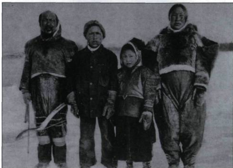
Certaines cultures savent mieux que d'autres se couvrir la tête et le haut du corps et ainsi diminuer la transpiration (qui glace l'épiderme lors de l'engel) tout en empêchant l'humidité de pénétrer dans les chaussures. (Carte postale, collection Simon Beauregard).

tropiques! Écoliers et travailleurs souhaitent alors la fermeture de leurs édifices. Parfois, la nouvelle s'étire plus longtemps que ne dure le phénomène. Pour utiles qu'elles peuvent être, les informations dramatisées révèlent une aversion — sinon une haine — de l'hiver et accroissent l'angoisse des personnes malades ou avancées en âge. En fait, toute la population se trouve ainsi soumise à une pression accentuée; ce genre de nouvelles constitue un stress additionnel.