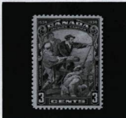
Timbres commémoratifs émis par les autorités postales canadiennes pour souligner le 400 e anniversaire de l'arrivée de Jacques Cartier (1934).

Malheureusement, plusieurs de ces timbres regroupent en réalité des séries à caractère thématique destinées à mousser la cote de popularité du pays auprès des collectionneurs. Car les autorités postales du monde entier ont vite compris tout le parti à tirer d'une telle ambiguïté. Pour des milliers de