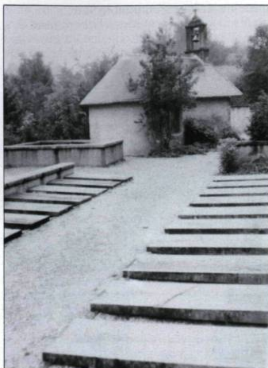
«Cimetière des Canadiens». La Salette-Fallavaux à la périphérie du massif de l'Obiou. (Photographie de l'auteur, septembre 1987).

s'est produit à l'est de la vallée du Rhône. Plus spécifiquement, sur quel chemin se trouve l'Obiou à partir de Montélimar, point de déviation? Par ailleurs, plutôt de chercher une cause unique, ne serait-il pas réaliste de s'orienter vers une série de forces ayant pu se manifester les unes par rapport aux autres?