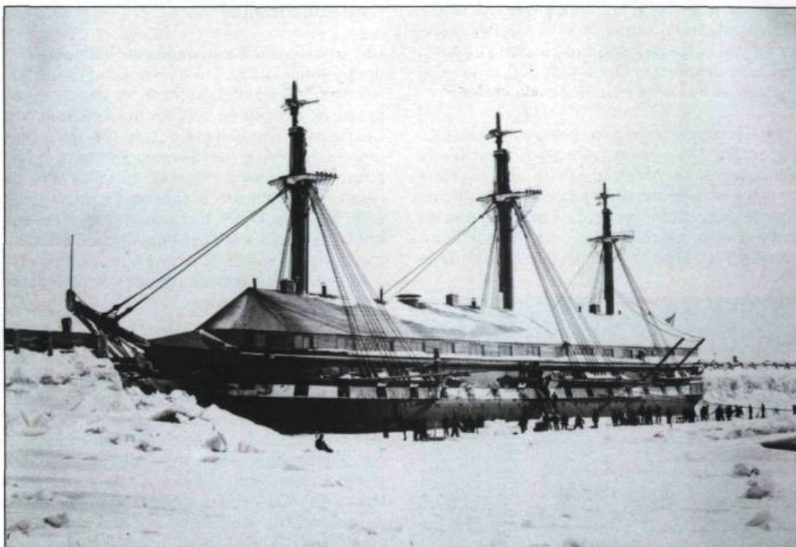
Le H.M.S. Aurora vers 1900. Cette photographie de Louis-Prudent Vallée montre un chantier de construction sous la neige; le pont est recouvert pour permettre le travail à l'intérieur. (Archives nationales du Québec à Québec, fonds Louis-Prudent-Vallée).