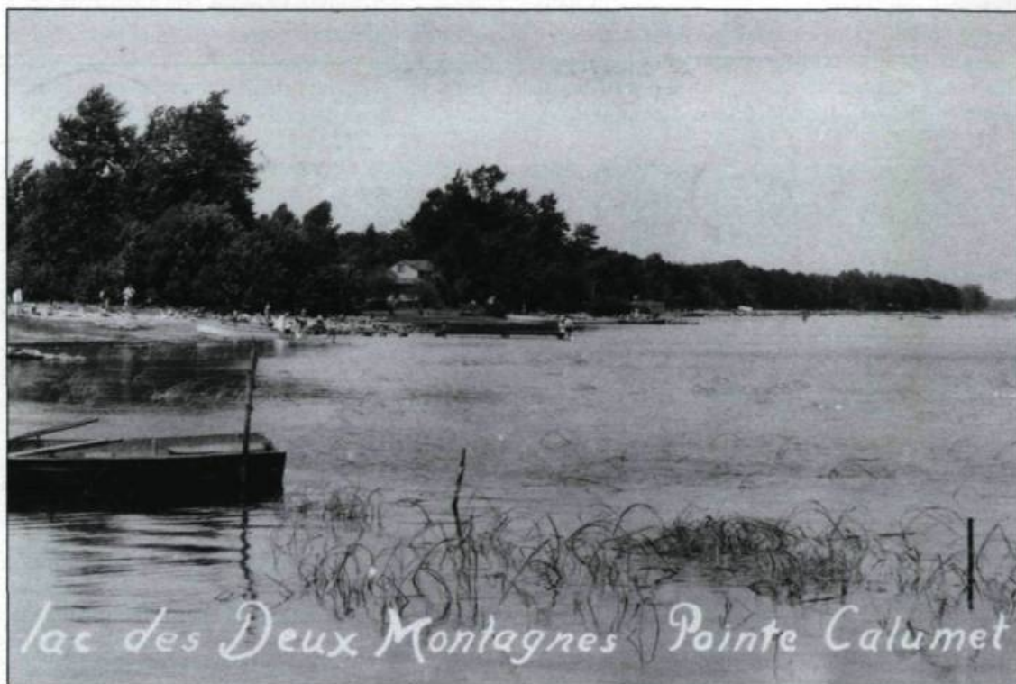
En 1939, le géographe Raoul Blanchard remarque de vastes mouvements de la population montréalaise au cours des mois d'été. Les rivières Mille Îles et des Prairies, les lacs Saint-Louis et des Deux Montagnes constituent des destinations privilégiées. (Carte postale Studio Beauchamps, collection Simon Beauregard).