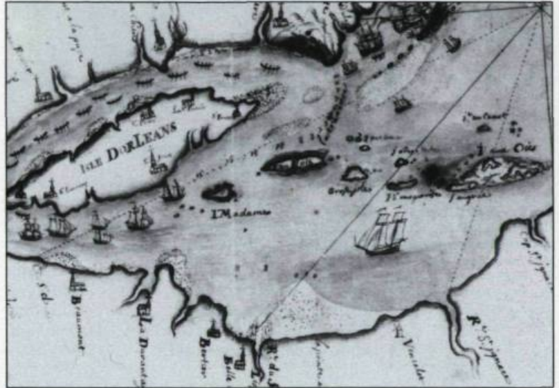
Carte de 1729 illustrant le naufrage du vaisseau du roi L'Éléphant (partie). À la hauteur de Cap-Saint-Ignace une barque remonte le fleuve en direction de Québec.

À cette époque, le capitaine Bernier songe vraisemblablement à l'établissement de ses enfants. En dépit de son âge avancé (55 ans d'après le recensement de 1716), il continue à travailler. En décembre 1716, il fait radouber sa barque par