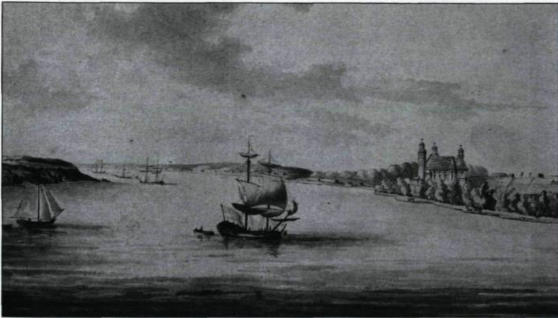
Le fleuve Saint-Laurent à Cap Santé. Selon Gédéon de Catalogne, les seigneuries de la rive sud... et certaines seigneuries de la région de Portneuf approvisionnaient la ville de Québec. (Archives nationales du Canada, aquarelle de James Hunter).