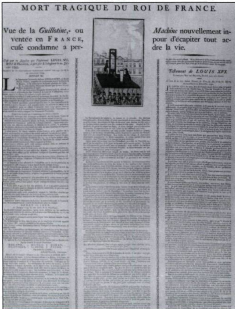
«Mort tragique du roi de France». Placard typographié et gravure à l'eau-forte, anonyme 1793. (Département des livres rares et des collections spéciales, université McGill, Montréal).

tations de la mort de Louis XVI dérivent en fait d'un modèle commun, soit le placard intitulé Massacre of the French King! View of the Guillotine, or the moderne Beheading Machine, at Paris , publié à Londres immédiatement après l'exécution du roi. Le placard typographié mis en vente par l'imprimerie Neilson présente une traduction française du décret de culpabilité voté par la Convention Nationale, l'ordre d'exécution du roi, la relation détaillée et pathétique de son supplice ainsi que son testament, rédigé le 21 décembre 1792 à la prison du Temple.