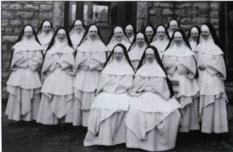
Groupes d'étudiantes inscrites à l'École des infirmières en 1939.

À cette époque, Ahern rencontre le docteur de Martigny et, à ses côtés, il s'initie aux rudiments de la médecine. Dès lors, ce jeune professeur découvre sa véritable vocation. En 1864, il s'inscrit à la faculté de médecine de l'université Laval.