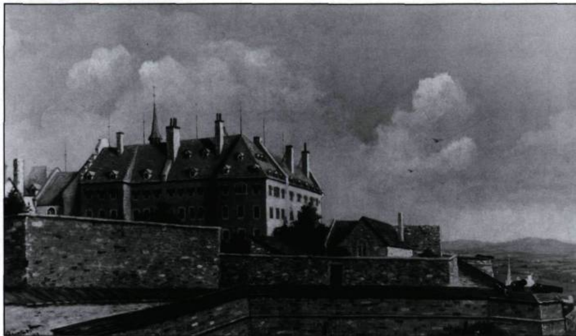
L'Hôtel-Dieu vu de la rue des Remparts en 1886, d'après H. Bunnett. (Ville de Québec, Division du Vieux-Québec).

L'espace disponible permet d'accueillir 50 lits; cependant, à cause des compressions budgétaires, l'hôpital compte à peine 20 places. Jus-