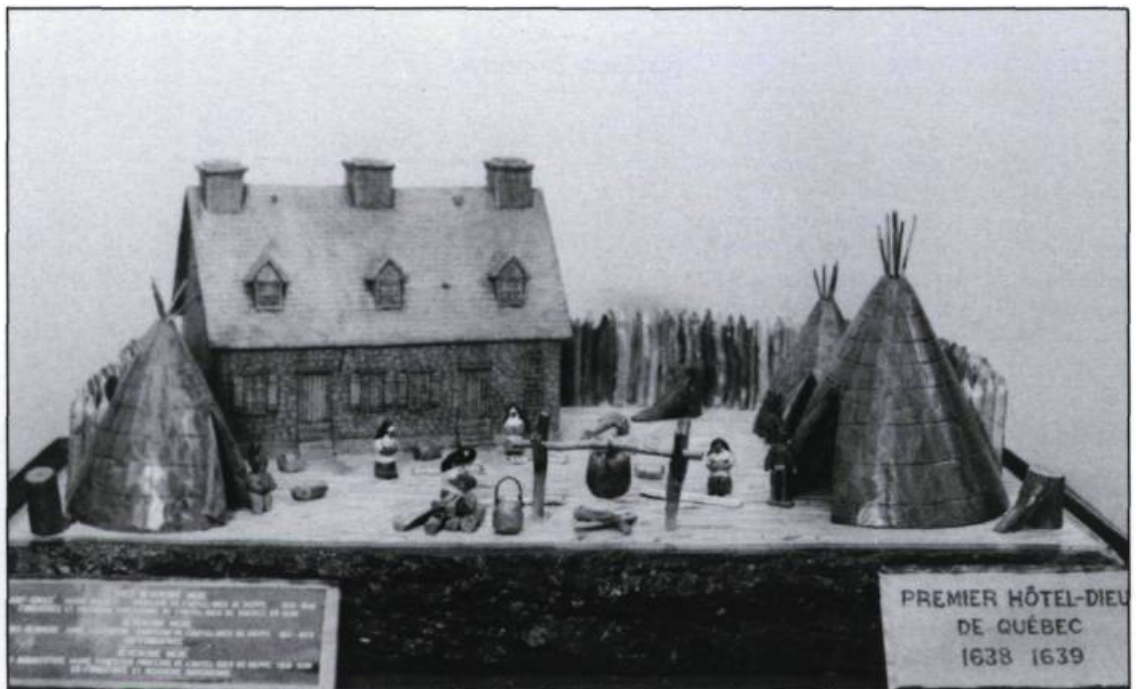
Maquette qui reproduit le premier Hôtel-Dieu de Québec situé à proximité de la rivière Saint-Charles. (Photographie médicale, Hôtel-Dieu de Québec).

Après l'incendie, les pères jésuites mettent à la disposition des hospitalières un bâtiment autre-