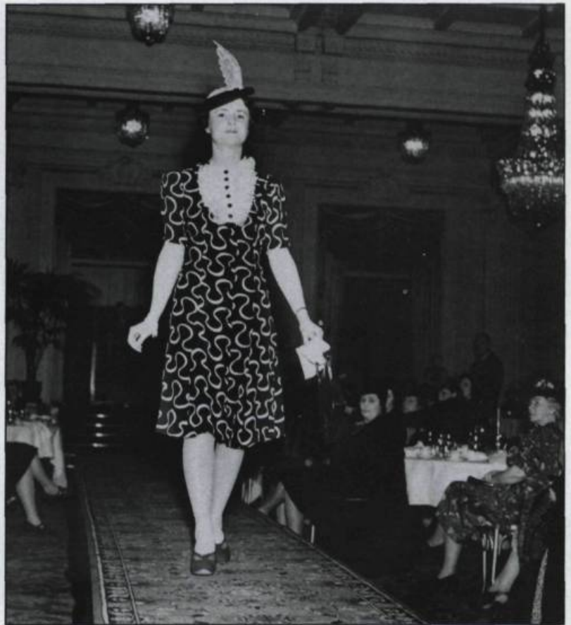
Défilé de mode à Montréal en avril 1939.

Au Québec, ce rôle des photographes débute, comme ailleurs en Occident, dès la fin du XIX e siècle. Les grands studios réalisent des clichés attrayants, diffusés en format cabinet, de vêtements et d'accessoires importés, offerts dans les grands magasins. Le petit musée d'Eaton, en Estrie, conserve quelques beaux spécimens pro-