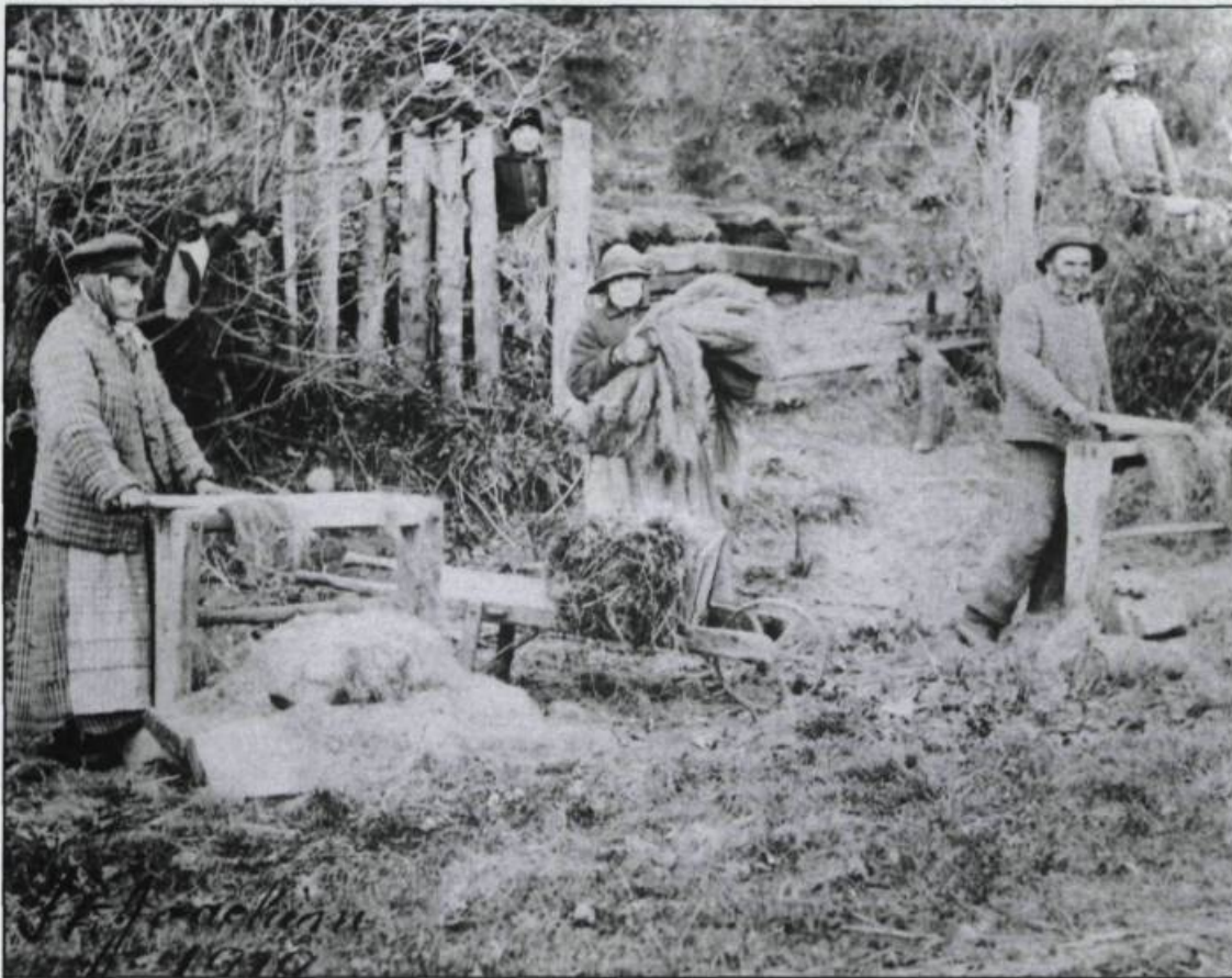
Corvée de «brayage» à Saint-Joachim en 1919.