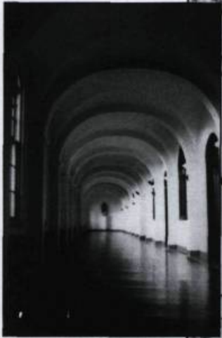
Le monastère des Dominicaines contemplatives de Berthierville en 1941. En médaillon, le cloître. (Archives des Dominicaines de Berthierville).