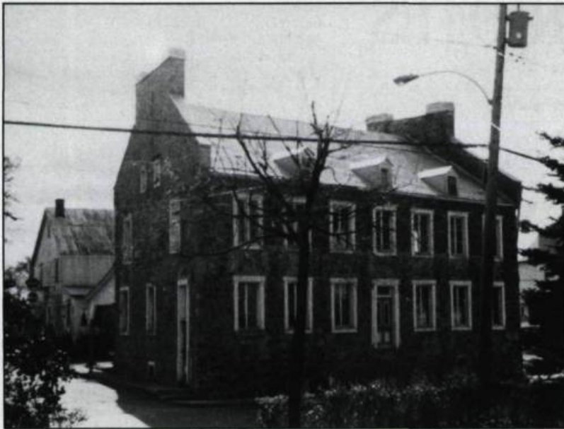
La maison de Jean-Baptiste Mâsse en 1976. (Maison nationale des Patriotes).

La maison Mâsse est un bâtiment de pierre de deux étages et demi dont le plan au sol adopte la forme d'un trapèze-rectangle. Pourvue de murs coupe-feu et possédant un très grand nombre d'ouvertures, cette maison est une des belles réalisations d'architecture commerciale urbaine implantée en milieu rural. Un puits au sous-sol, découvert au cours de récentes fouilles archéologiques, ajoute à l'intérêt historique et architectural de cette maison ancienne. Construite vers 1803, elle a servi d'auberge et de magasin général