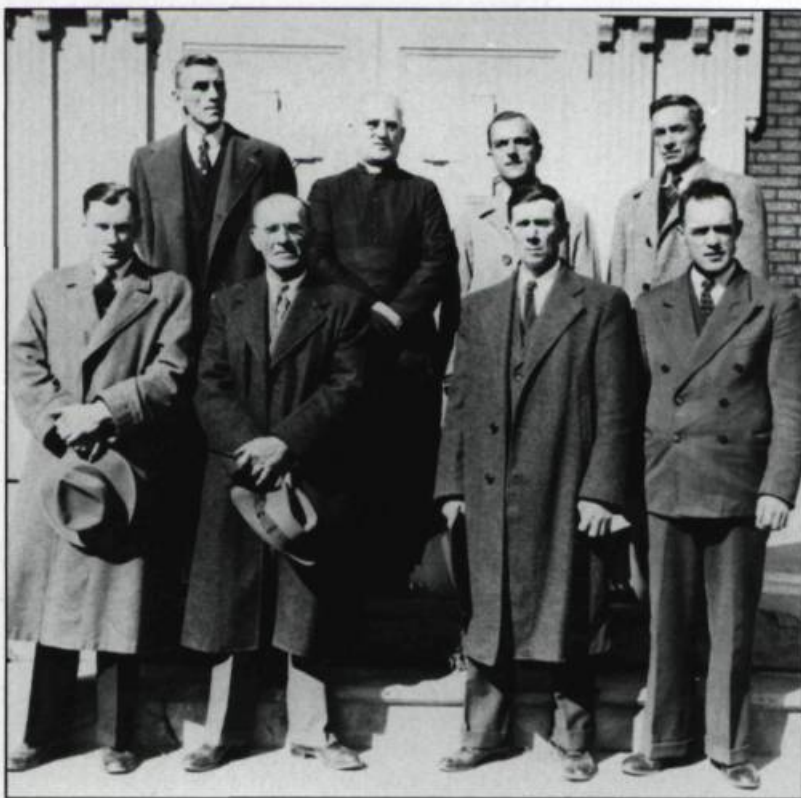
Photo prise au moment du départ de Mgr Félix-Antoine Savard du village de Clermont, le 30 septembre 1945.

études particulières de l'auteur. Une collection d'images pieuses témoigne de certaines dévotions et de l'iconographie religieuse de l'époque. Une correspondance entretenue avec des amis, des paroissiens ou des responsables d'organismes révèle les intenses relations de ce prêtre avec la société.