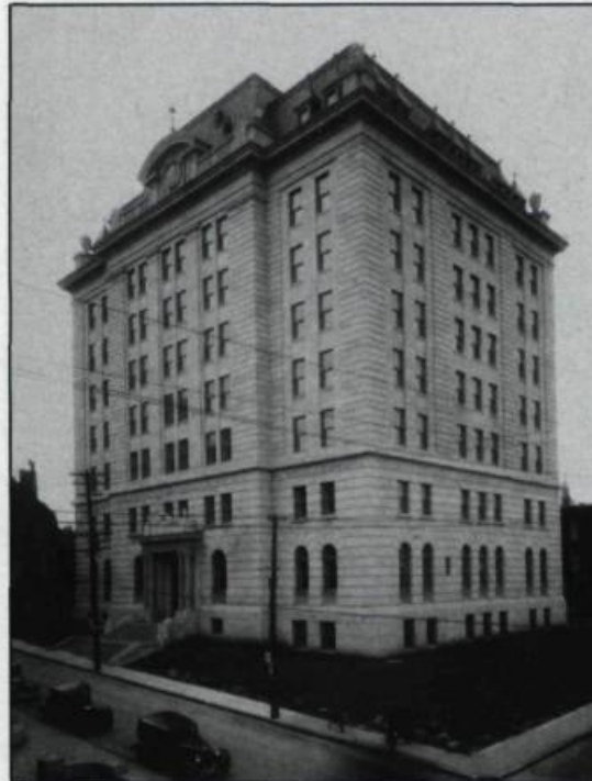
L'édifice «D», que la Société immobilière du Québec vient de restaurer, a été construit en 1931-1932 pour loger un ministère en pleine expansion: l'Agriculture. La construction visait notamment à contrer le chômage.

Tout aussi francophile, l'idéologie libérale qu'incarne Taschereau prône le renouvellement de la société par l'industrialisation et l'éducation. Cette