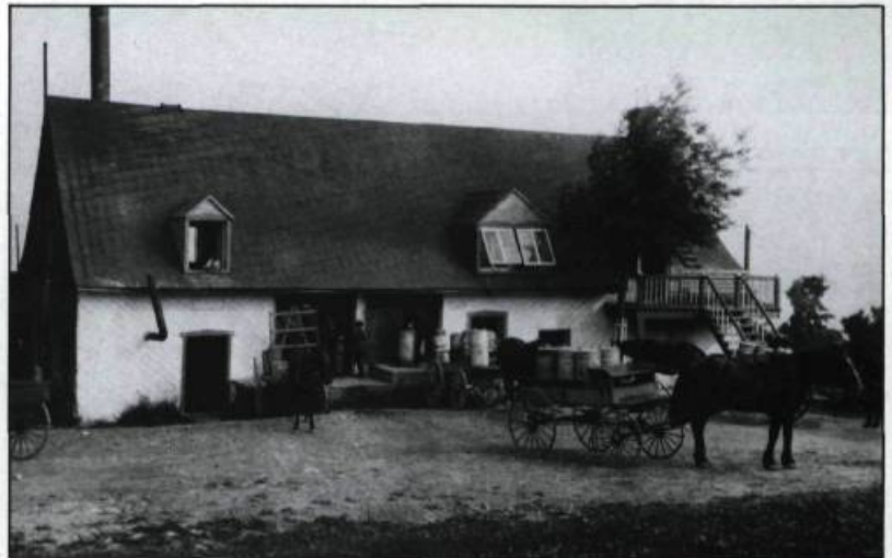
L'île d'Orléans. 1928, 505 pages, 88 photographies reproduites.

On remarque ici la réalisation d'un bel ouvrage s'apparentant beaucoup aux livres dits «d'art». De nombreux poèmes en agrémentent la lecture ainsi que des reproductions en couleurs de peintures de Charles Maillard, Horatio Walker et Henry Carter. La photo d'architecture représente cependant le leitmotiv d'une telle entreprise. Pas moins de vingt clichés sont l'oeuvre d'Edgar Gariépy comme le prouve l'index de sa collection.