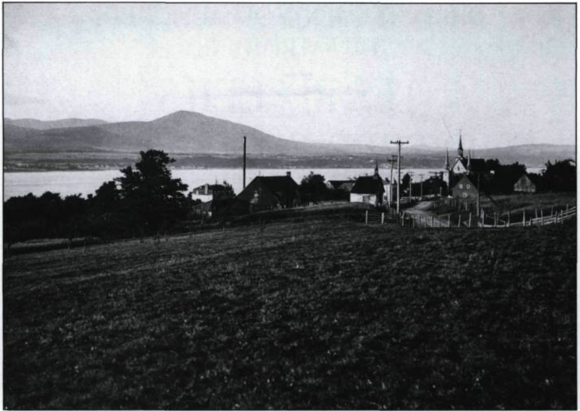
Vue générale de la paroisse Sainte-Famille de l'île d'Orléans vers 1920, extraite du volume de Pierre-Georges Roy, L'île d'Orléans . (Photo: Edgar Gariépy, Collection Initiale, Archives nationales du Québec).

dernière l'emporta malgré le fait qu'elle se soit heurtée au pouvoir économique et politique. Groulx sera l'un des principaux porte-paroles de cette idéologie tournée vers le passé et vers l'idéalisation de la Nouvelle-France. Le culte des vertus ancestrales et des racines catholiques et françaises relance alors le discours nationaliste. Dans l'après-guerre le terroir fut aussi remis à l'honneur sous plusieurs formes artistiques.